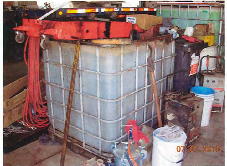
Réservoir hors-sol de 1000 litres utilisé pour l'entreposage de l'huile usée provenant des véhicules.

Photos présent par Louis Bouchard, le 7 juillet 2010.