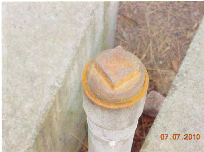
Le bouchon de la tuyauterie extérieure est fortement marqué par la corrosion.