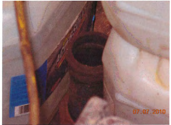
Tuyau servant au transfert de l'huile usée à partir de l'intérieur du garage, jusque dans le réservoir souterrain.