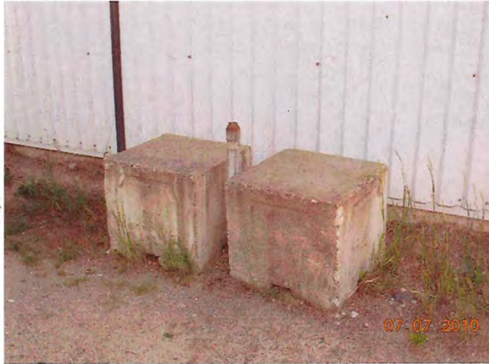
Tuyau servant à la vidange du réservoir souterrain. Des blocs de béton le protège des véhicules.

2034, boul. Albiny-Paquette, Mont-Laurier (Conrad et Edgar Lacasse Inc.) 7610-15-01-02671-03