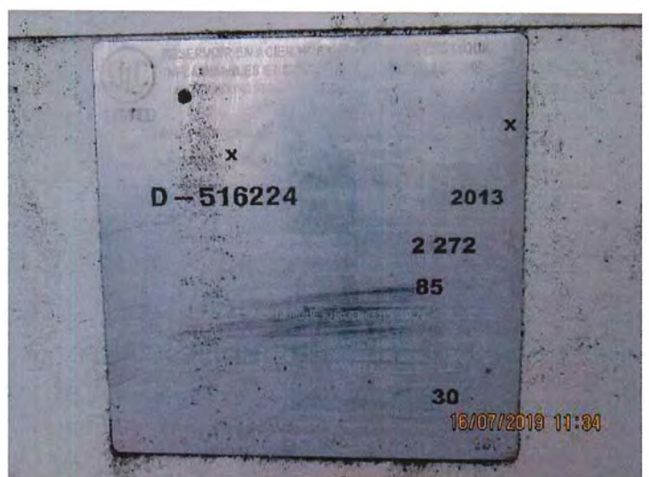
IMG_3058.JPG Spécification réservoir d'essence