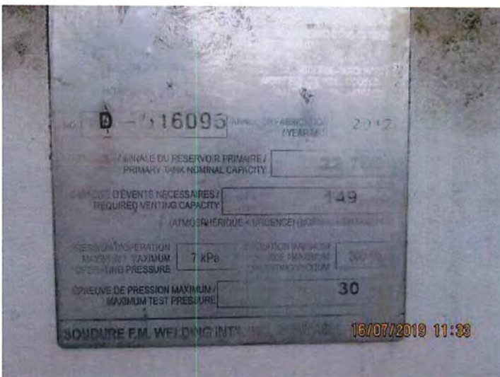
IMG_3056.JPG Spécification réservoir de diesel