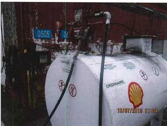
IMG_3059.JPG Réservoir d'essence