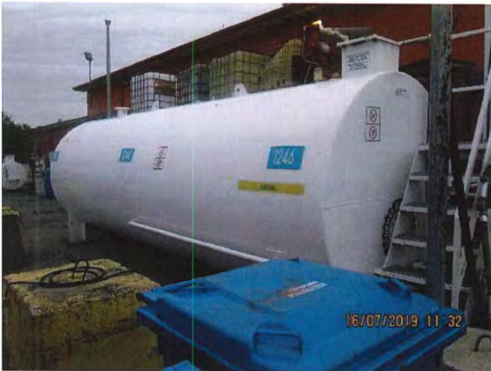
IMG_3054.JPG Réservoir de diesel