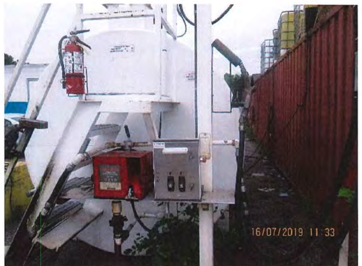
IMG_3055.JPG Réservoir de diesel