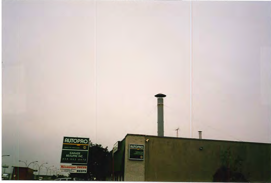
PHOTO: 5 DATE: 02-10-23 Reservoir d'entre- posage pour l'huile usée.

PHOTO: 4 DATE: 02-10-23 Chapeau sur la cheminée de la salle de peinture. Celui-ci sera remplacé par un cône d'accélération.