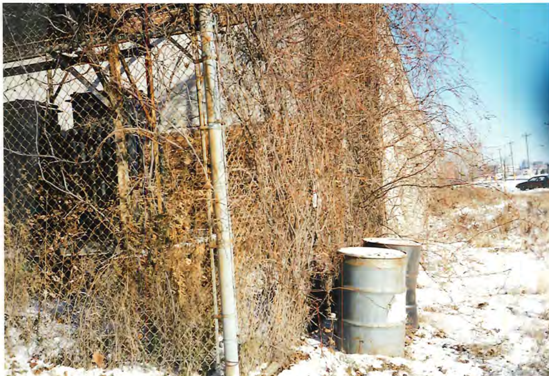
Photo # : 5 Date : 2000/12/08 Ident. : 5600, rue Paré Note : Autre vue des barils

Photo # : _____ Date : _____ Ident. : _____ Note : _____