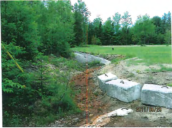
fossé à l'arrière du dépanneur

7610-15-01-03389-03 343 côte Saint-Nicola à Saint Colomban