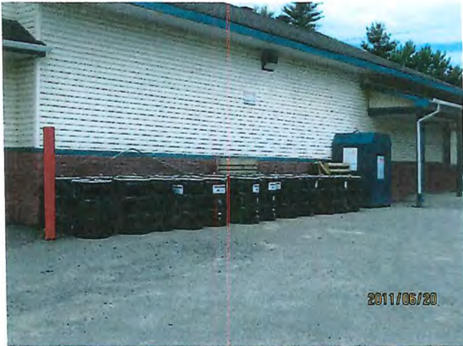
barils de charbon activé