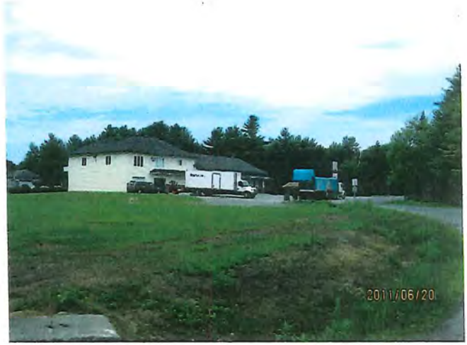
fossé coté de la route