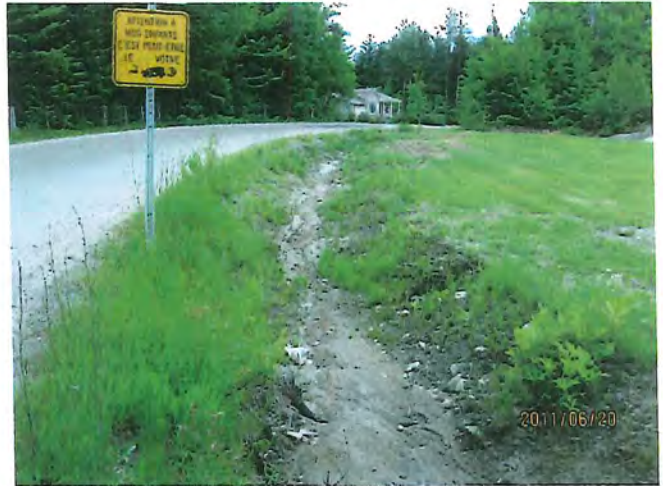
fossé où se faisait le rejet des eaux traitées