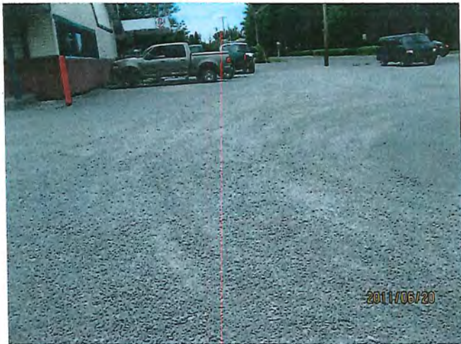
endroit où se trouvait l'ancien poste d'essence