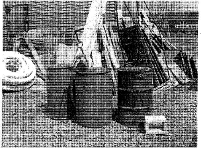
Photo 2. vu des barils d'huile hydrique