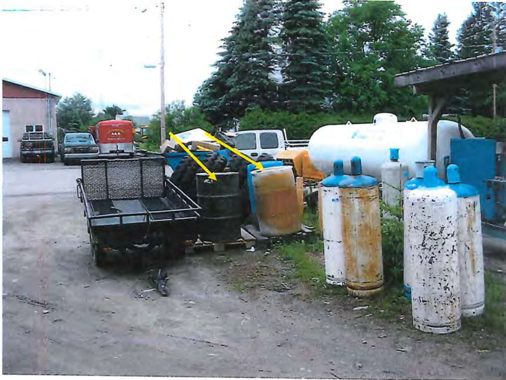
Photo no. 1 : Trois barils contenant des huiles usées sont entreposés directement à l'extérieur sans abri, sans bassin de rétention d'urgence et aucun ne porte une étiquette en vertu du RMD. Selon M. Larente les huiles proviendraient uniquement de l'atelier mécanique.

Localisation : 47, 12 ième rue, Ferme-Neuve (Québec). Intervenant : Garage Marcel Larente inc. Date : 30 juin 2004 N/RÉF : 7610-15-01-01106-03 (général village Ferme-Neuve)