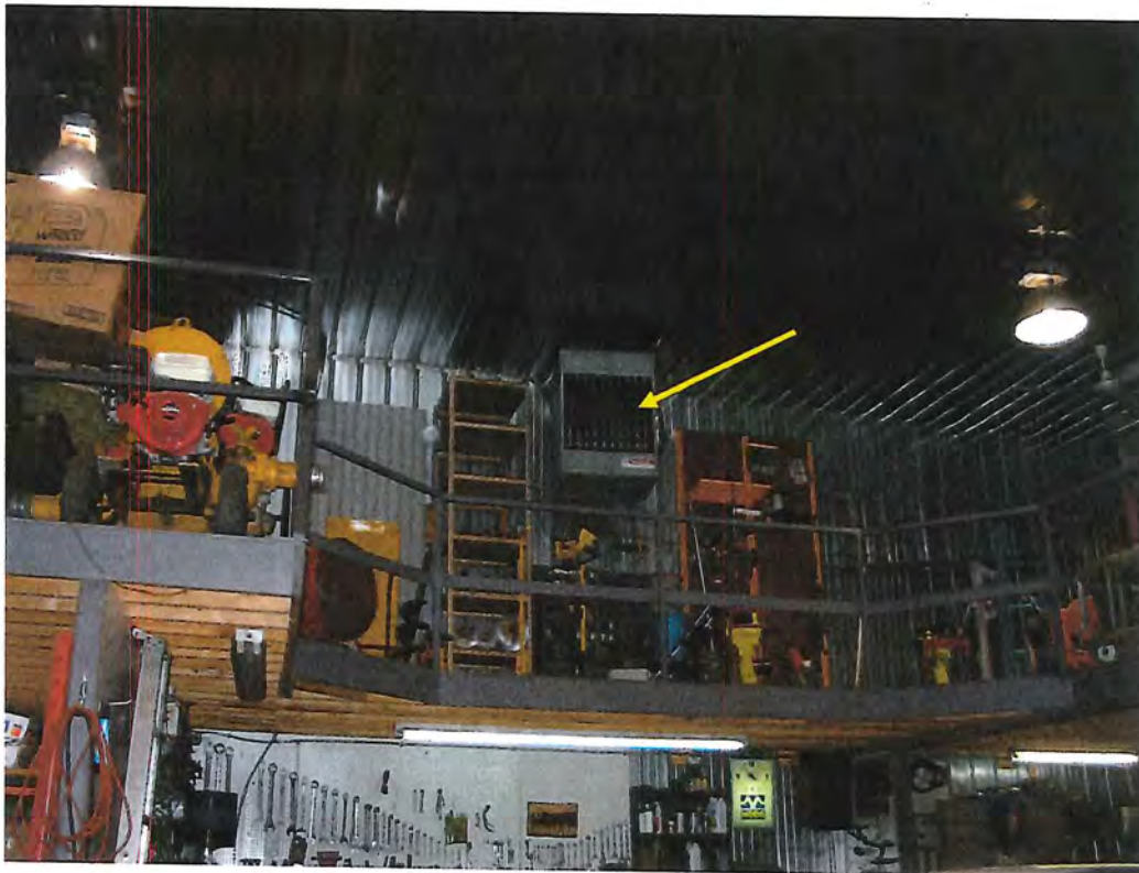
Photo no. 1 : J'ai pu observer le système de chauffage du garage cette fois et il appert qu'il ne s'agisse pas de brûlage d'huile usée. Cette fournaise n'est pas conçue pour permettre cette pratique.

Localisation : 47, 12 ième avenue à Ferme-Neuve. Intervenant : Garage Marcel Larente inc.. Date : 2 septembre 2004 N/RÉF : 7610-15-01-01106-03 (général Ferme-Neuve)