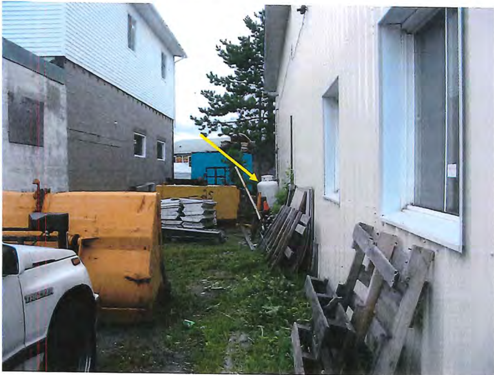
Photo no. 2 : La plainte qui mentionnait que le commerce brûlerait des huiles usées pourrait être non fondée. Le garage serait alimenté et chauffé à l'aide de cette bombonne contenant du Propane selon M. Larente. Lors de la prochaine inspection, vérifier dans le garage. Cette bombonne de propane pourrait servir uniquement de brûleur à une unité de fournaise qui brûlerait des huiles usées.

Photo no. 1 : Trois barils contenant des huiles usées sont entreposés directement à l'extérieur sans abri, sans bassin de rétention d'urgence et aucun ne porte une étiquette en vertu du RMD. Selon M. Larente les huiles proviendraient uniquement de l'atelier mécanique.