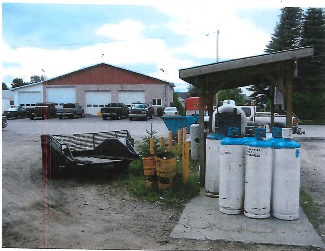
Photo no. 2 : Les matières dangereuses (barils d'huiles usées) ont été retirés de l'extérieur puis rentré dans le garage de réparations mécaniques. Les palettes sont absentes aussi. Il n'y avait qu'un seul baril d'huile usée lors de l'inspection.