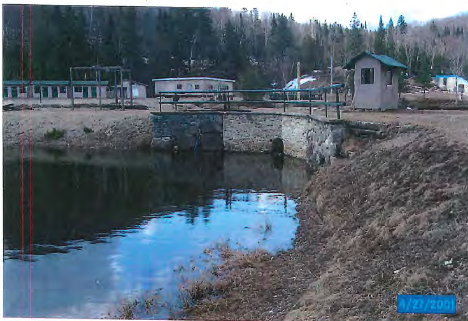
Photo no. 2 - Partie du mur de rétention du bassin no 3, qui à été réparé en 2000. Photo prise à partir du bassin no 1.