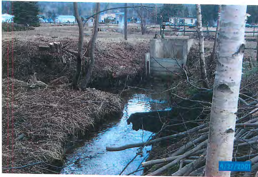
Photo no. 1 - Ruisseau sans nom et boîte de distribution