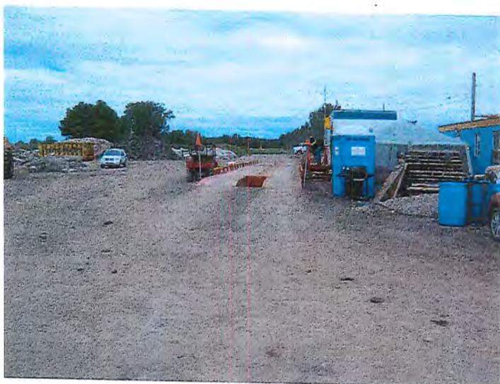
IMG_3900.JPG Balance à l'entrée du site