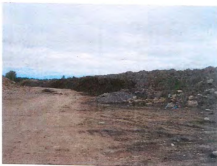
IMG_3896.JPG Section supplémentaire, en dehors de l'aire autorisée, qui est à être aménagée