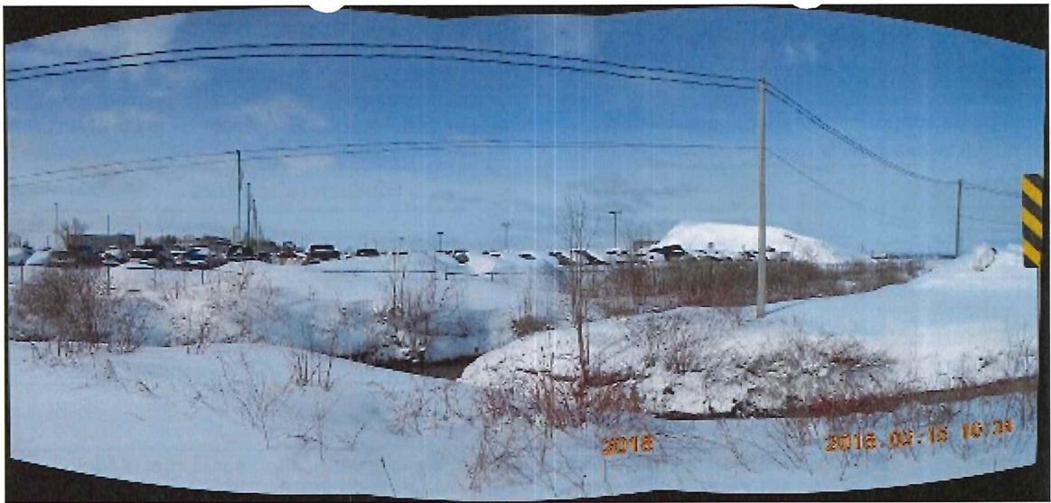
DSCN5524 (640x480) Panorama.jpg

1. Prise de vue générale du lieu visé par la plainte