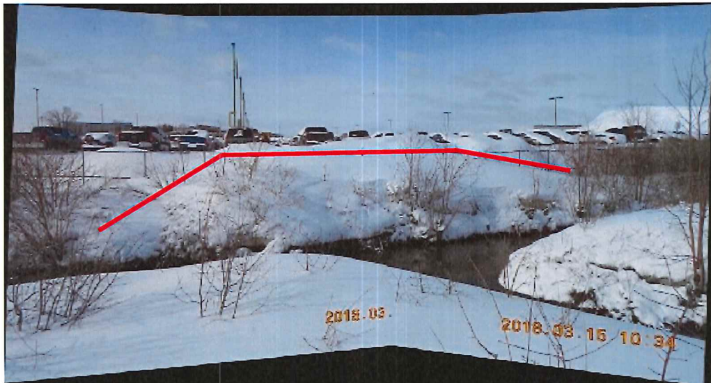
DSCN5529 (640x480) Panorama.jpg

2. Amas de neiges poussées au-delà de la clôture située à la limite est du lot 1 522 912 et accumulation de neiges dans la rive du ruisseau Bouchard