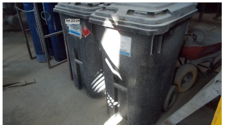
Art 23-24 .jpg Les contenants de MDR.