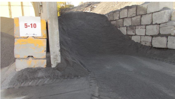
Art 23-24 .jpg Entreposage de matières premières (agrégats).