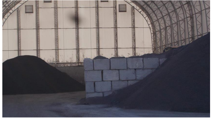
Art 23-24 .jpg Entreposage de matières premières (agrégats).