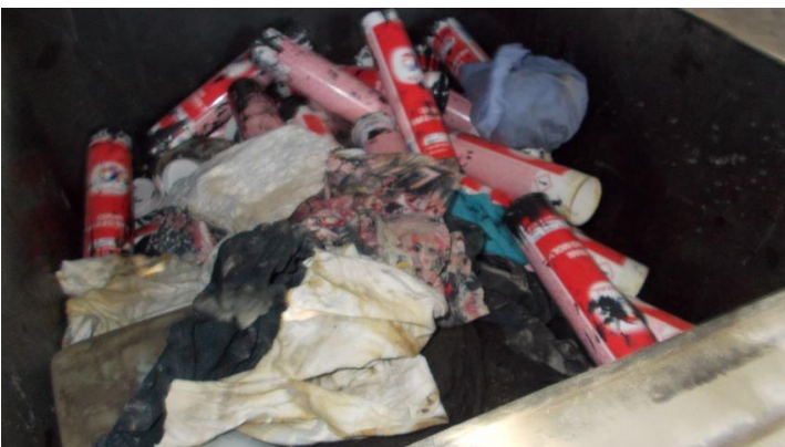
Art 23-24 .jpg Les contenants de MDR.