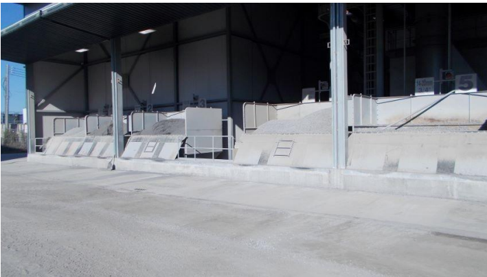
Art 23-24 .jpg Vue de quelques installations.