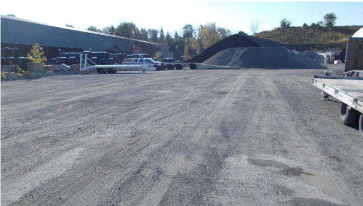
Art 23-24 .jpg L'emplacement de l'ancienne usine de béton bitumineux.