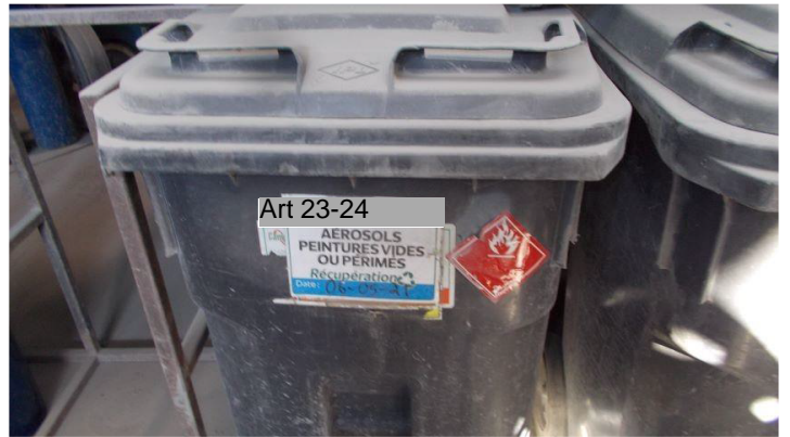
Art 23-24 .jpg Les contenants de MDR.