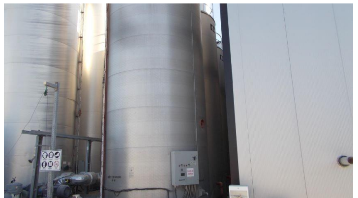
Art 23-24 .jpg Vue des réservoirs d'entreposage de bitume liquide.