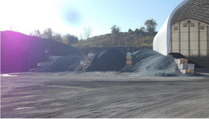
Art 23-24 .jpg L'emplacement de l'ancienne usine de béton bitumineux.