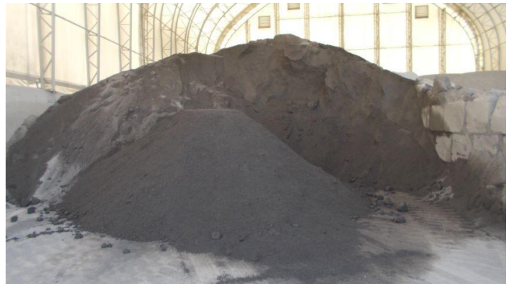
Art 23-24 .jpg Entreposage de matières premières (agrégats).