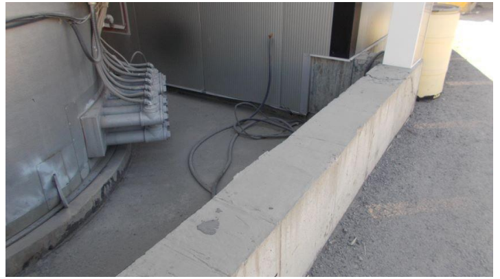
Art 23-24 .jpg Vue du bassin de rétention des réservoirs.