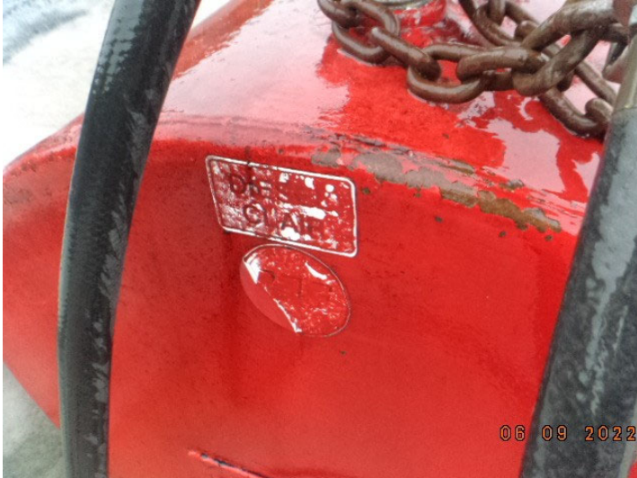
DSC03766.JPG Fiche d'information sur un réservoir