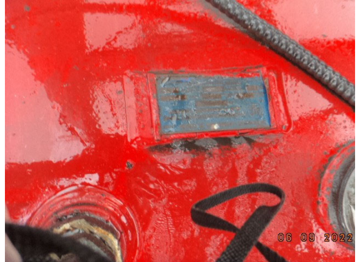
DSC03767.JPG Fiche d'information sur un réservoir