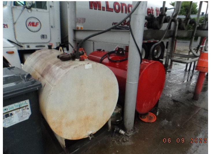
DSC03769.JPG Réservoirs de produits pétroliers