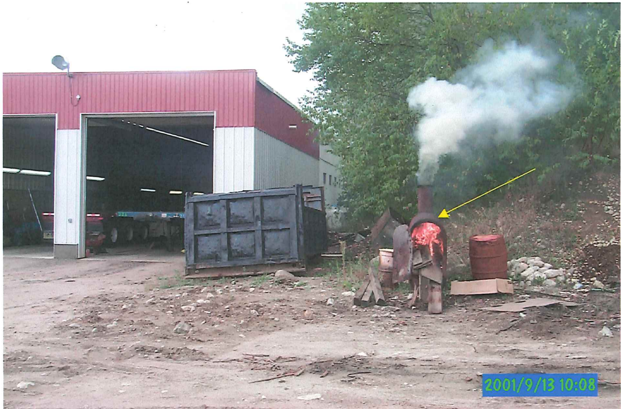
Photo no. 1: Un poêle constitué d'un réservoir de métal modifié fait office d'incinérateur. Des planches sont brûlées sur le site du garage. Brûlage de déchets à ciel ouvert par un commerce.

Localisation : 885 route 309, Saint-Aimé-du-Lac-des-Îles (Québec). Identification : Garage Jean-Yves Piché 1984 inc. Date : 13 septembre 2001 N/RÉF : 7610-15-01-01144-03