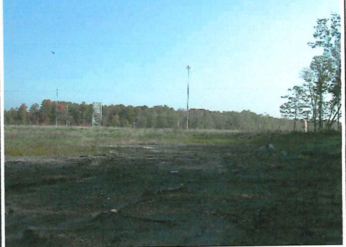
# 2 Description : Positionné à la limite Sud du lot vue en direction Est.