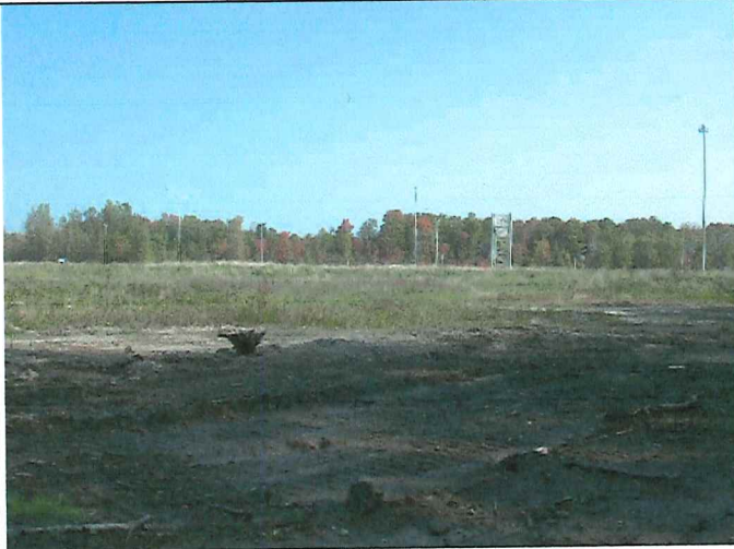
# 1 Description : Positionné à la limite Sud du lot vue en direction Est.