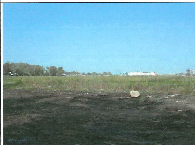
9 Description : Positionné à la limite Sud du lot vue en direction Nord Ouest.