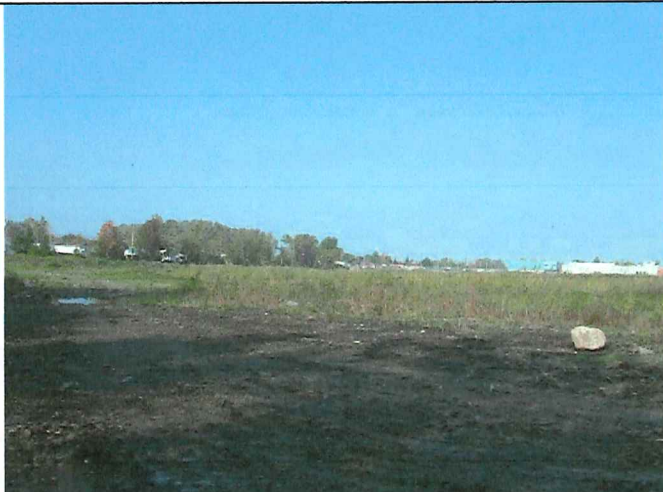
# 8 Description : Positionné à la limite Sud du lot vue en direction Nord Ouest.