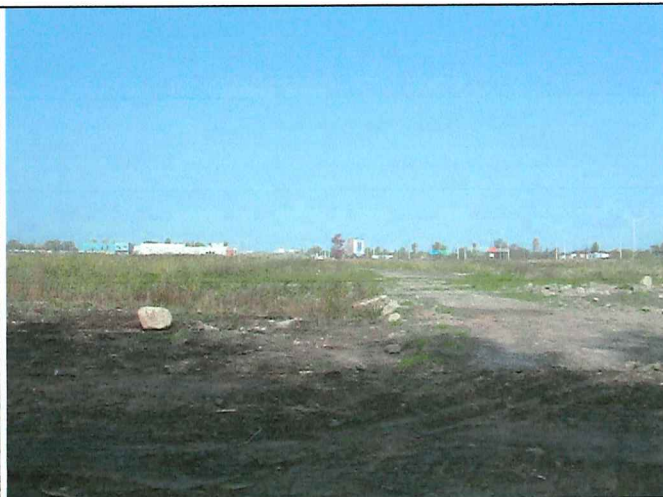
10 Description : Positionné à la limite Sud du lot vue en direction Nord.