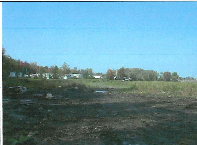
# 7 Description : Positionné à la limite Sud du lot vue en direction Ouest.