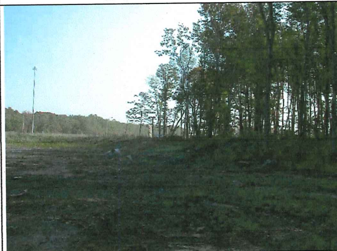
# 3 Description : Positionné à la limite Sud du lot vue en direction Sud Est.