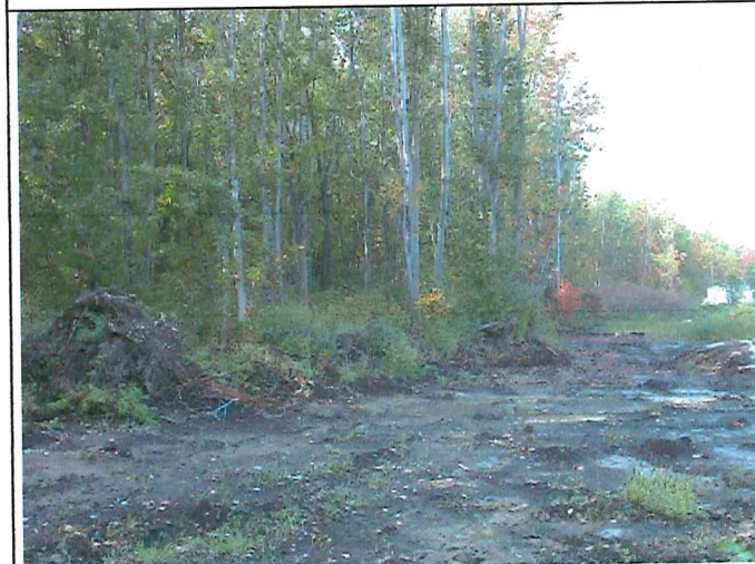
# 5 Description : Positionné à la limite Sud du lot vue en direction Sud Ouest.