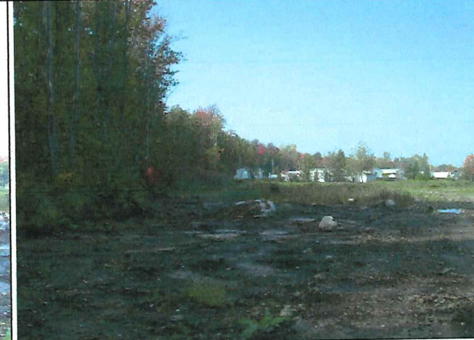
# 6 Description : Positionné à la limite Sud du lot vue en direction Ouest.