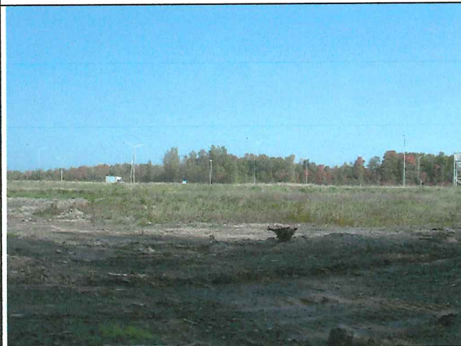
12 Description : Positionné à la limite Sud du lot vue en direction Nord Est.