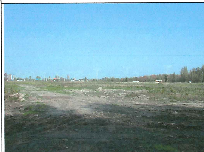
11 Description : Positionné à la limite Sud du lot vue en direction Nord.