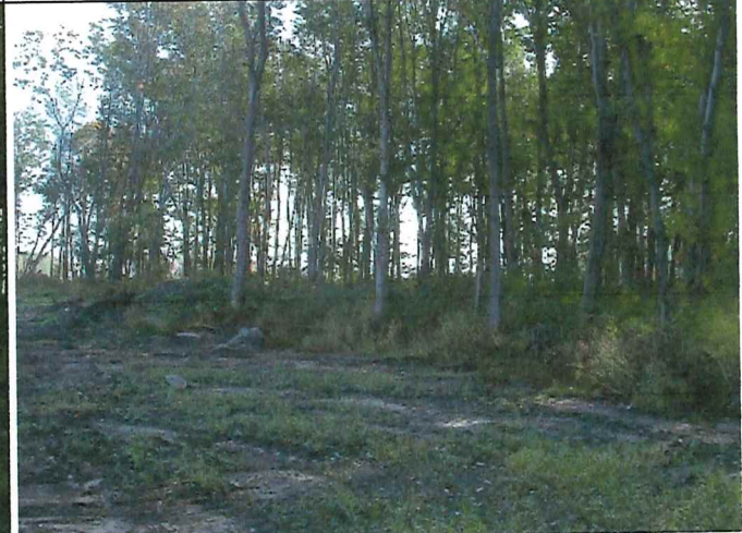
# 4 Description : Positionné à la limite Sud du lot vue en direction Sud Est.