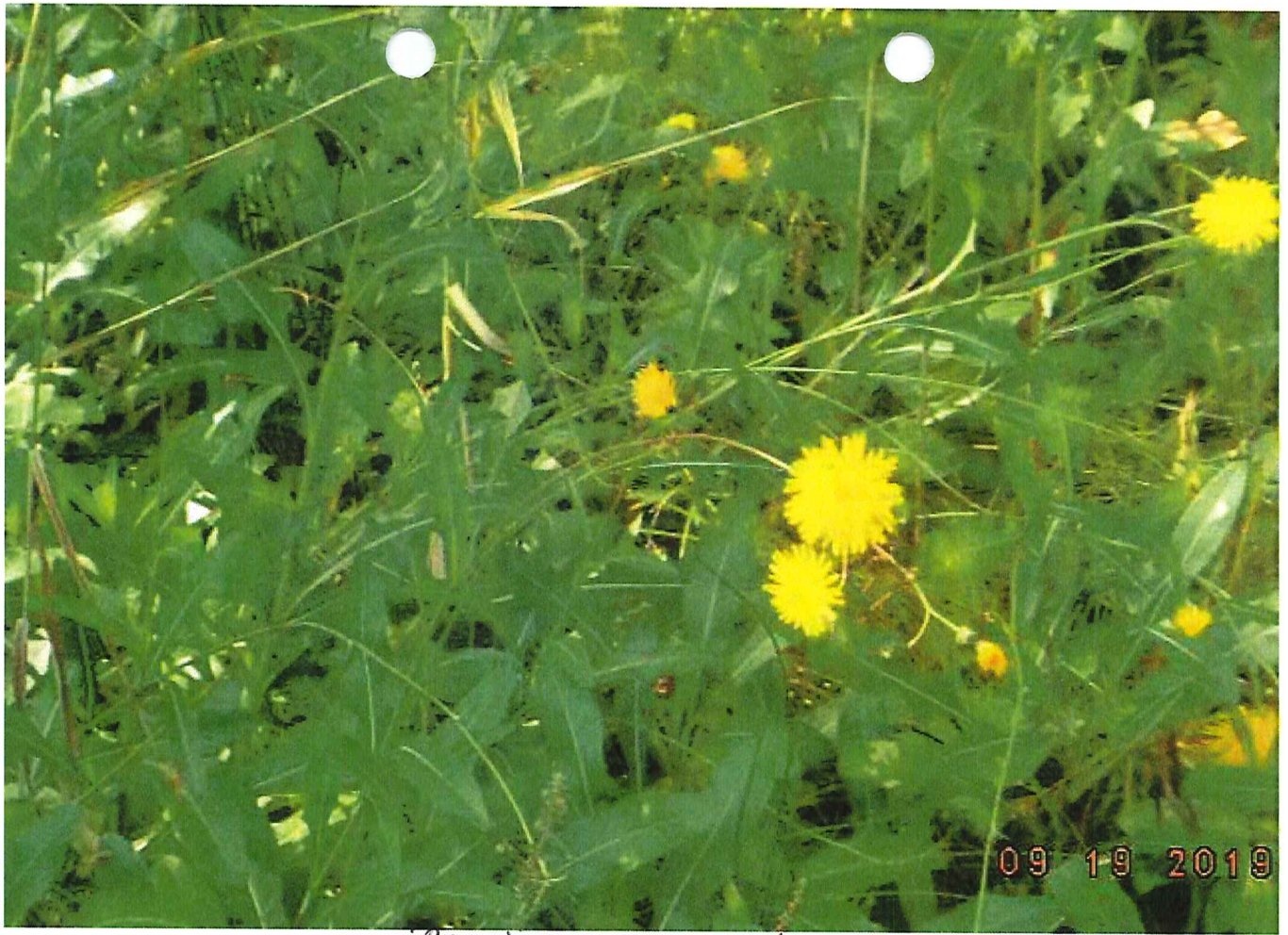
ÉPRAVIER EN OMBRE