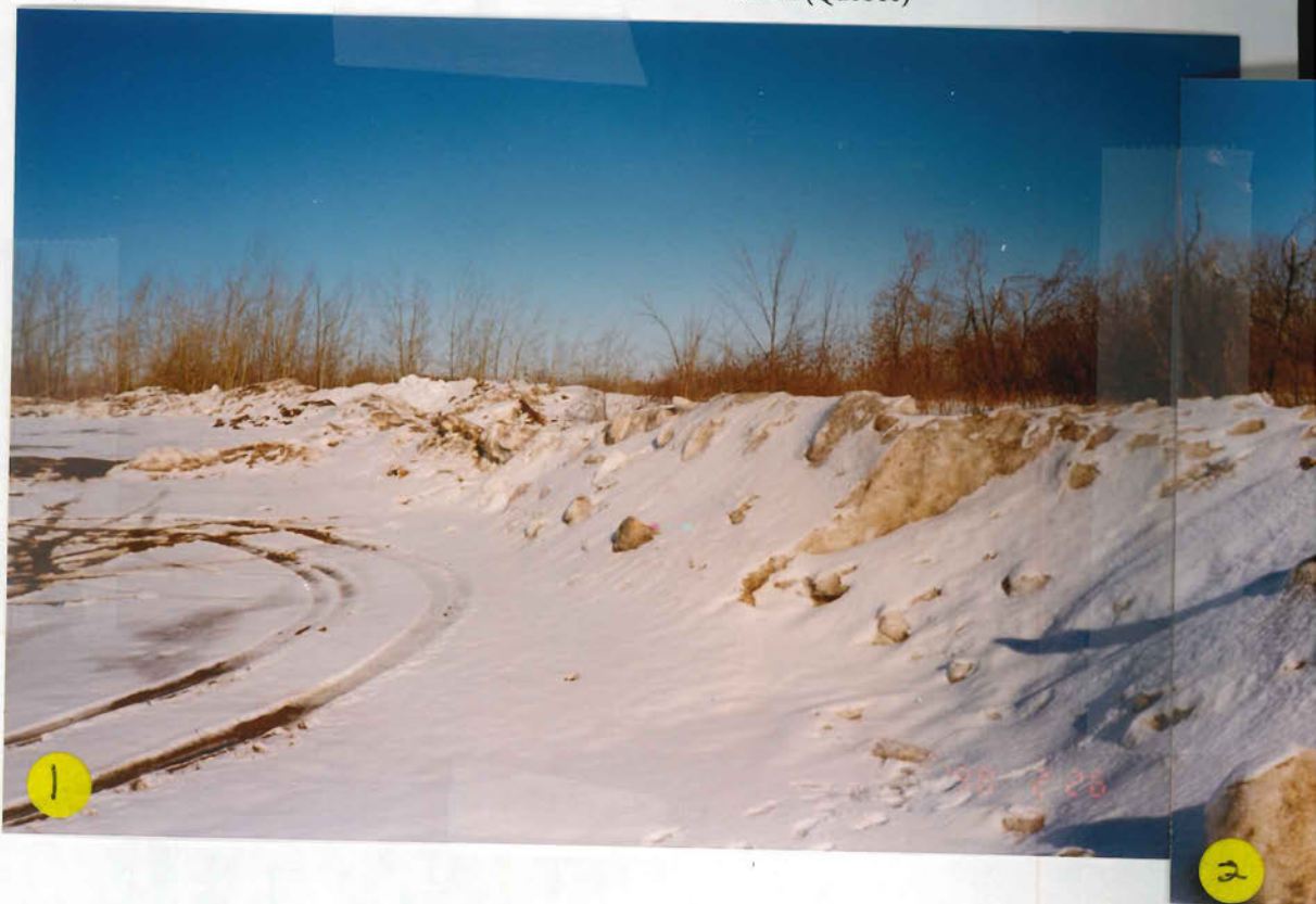
PHOTO: _____ DATE: _____ NOTE: _____ _____ _____ _____ _____ _____ _____

PHOTO: 1 et 2 DATE: 98-2-26 NOTE: Tas de neiges usées déposés. En arrière des tas à gauche de la photo 2, on y aperçoit d'autres tas de neiges usées voir photo 3