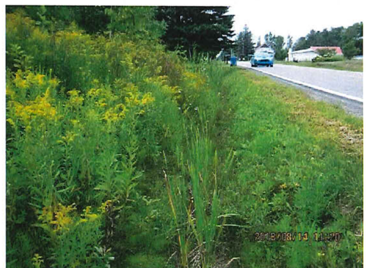
photo 6 fossé du rang du cordon