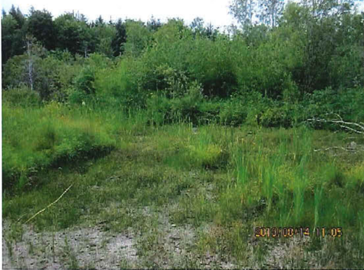
photo 13 première station d'identification