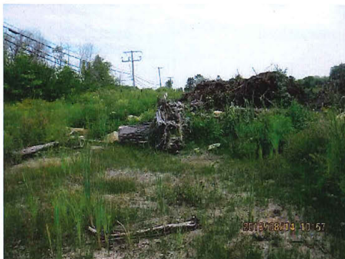
photo 5 dépression au bout du remblai