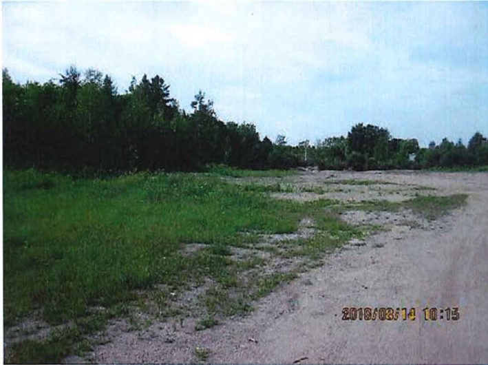
photo 1 vue d'ensemble du remblai