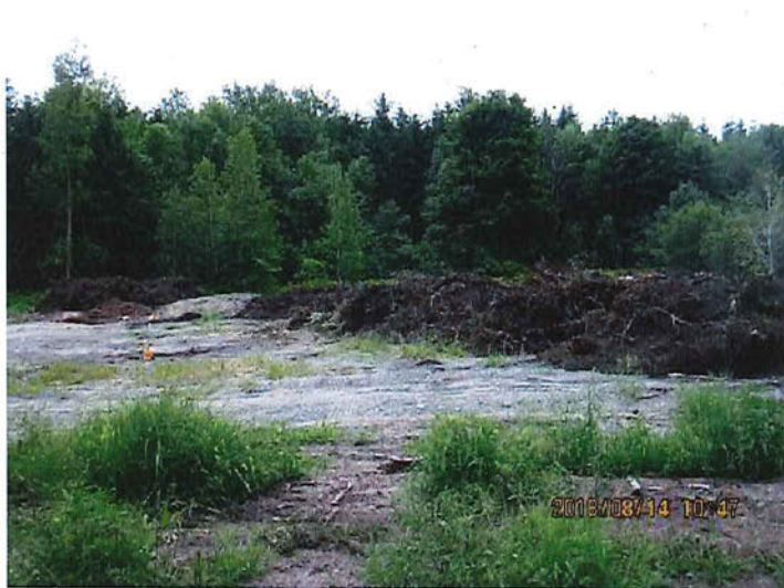
photo 3 monticule de sol et de branche sur le dessus du remblai