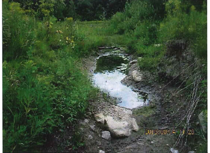
photo 8 petite accumulation d'eau entre le remblai et le fossé