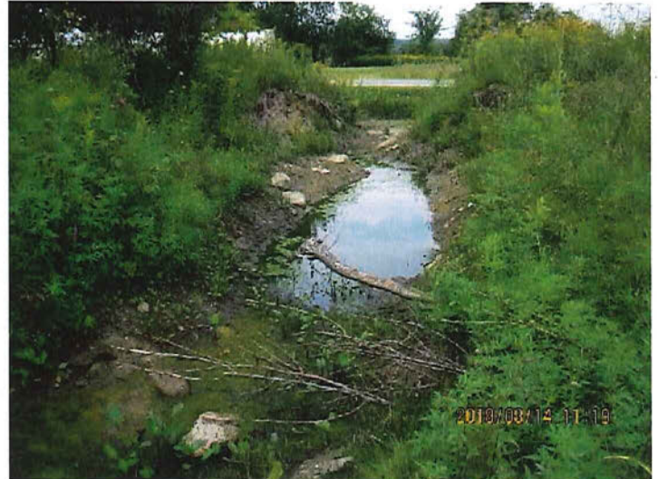
photo 10 petite accumulation d'eau entre le remblai et le fossé