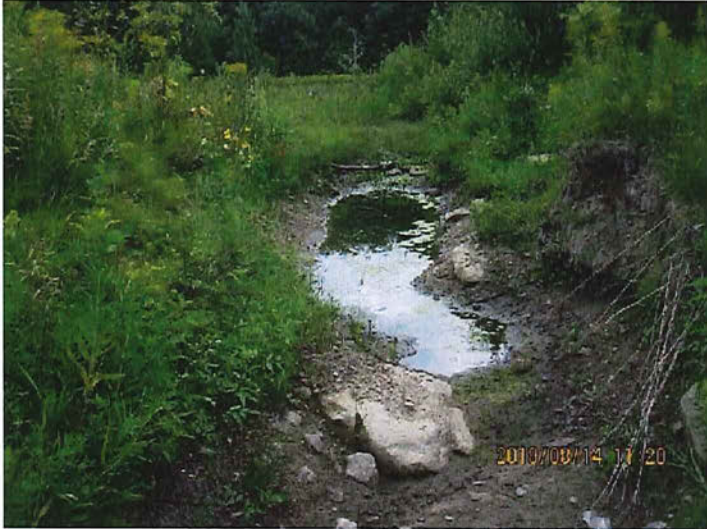
photo 9 petite accumulation d'eau entre le remblai et le fossé