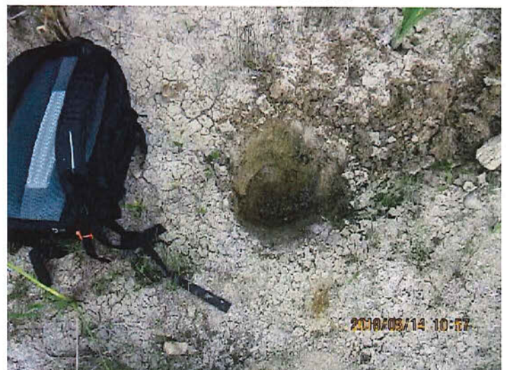
photo 12 sondage du sol à la première station d'identification