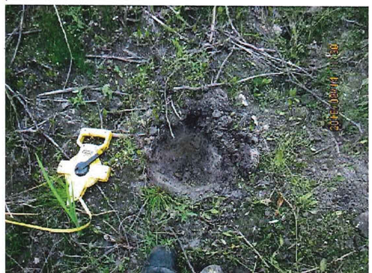
photo 18 sondage à la seconde station d'identification