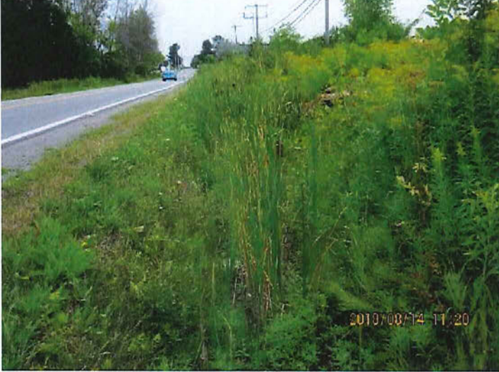
photo 7 fossé du rang du cordon