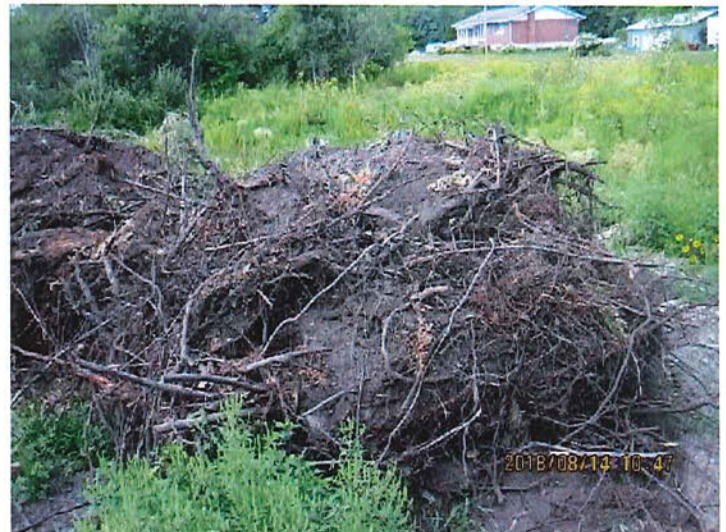
photo 4 monticule de sol et de branche sur le dessus du remblai