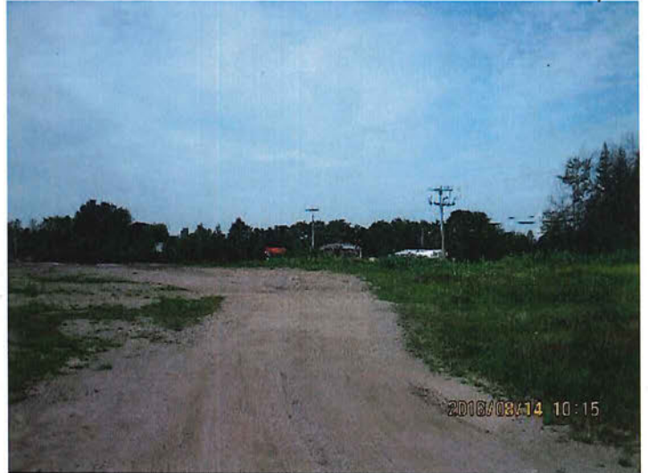
photo 2 vue d'ensemble du remblai