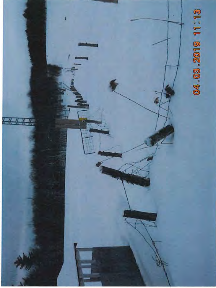
Image 5 : Vue de l'arrière de l'amas de sel et de sable sans écoulement