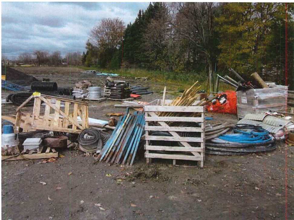
IMG_1819.JPG Image 7.