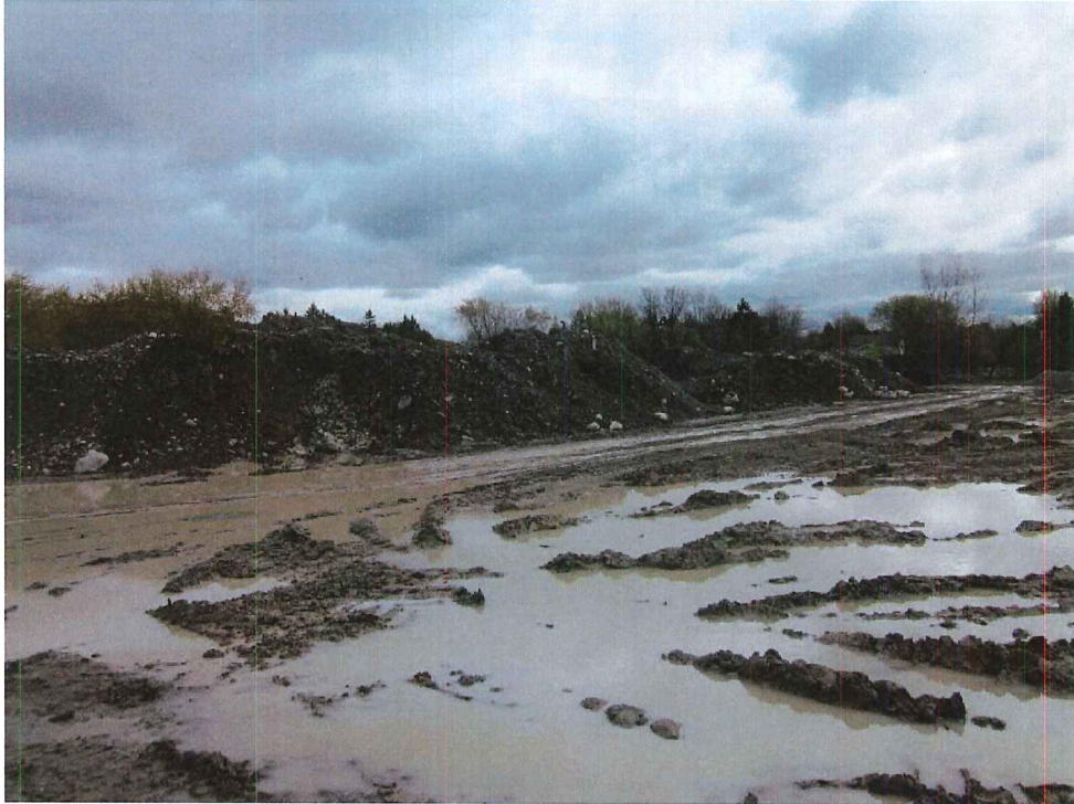
IMG_1815.JPG Image 5.