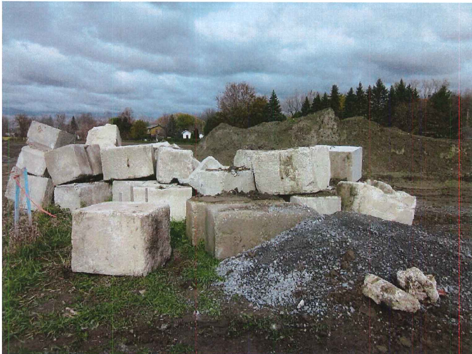
IMG_1818.JPG Image 6.