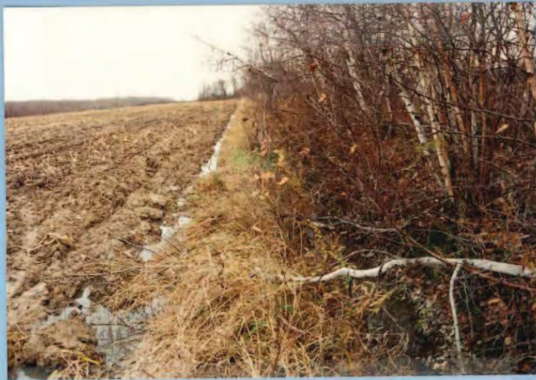
Photo #: 8 Date: 94-11-08 1865-01-04 Nom: // // Municipalité: // // Note: A CERTAIN ENDROIT L'EPANDAGE AVAIT ETE FAIT A UNE BONNE DISTANCE DU FOSSE