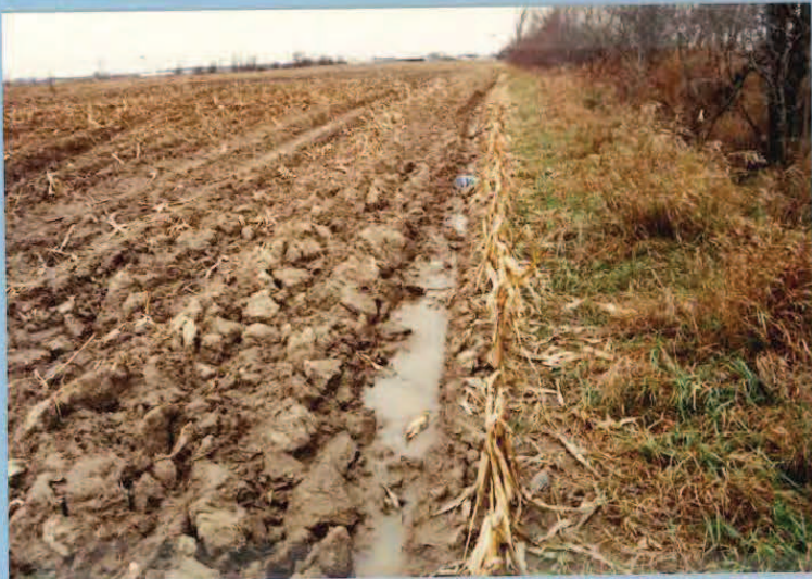
Photo #: 9 Date: 94-11-08 Nom: // // Municipalité: // // Note: ECLAISSAGE ET ROUSSILLONNAGE DU LISIER DU CHAMP VERS LE FOSSE DU MILLON

Photo #: 8 Date: 94-11-08 1865-01-04 Nom: // // Municipalité: // // Note: A CERTAIN ENDROIT L'EPANDAGE AVAIT ETE FAIT A UNE BONNE DISTANCE DU FOSSE