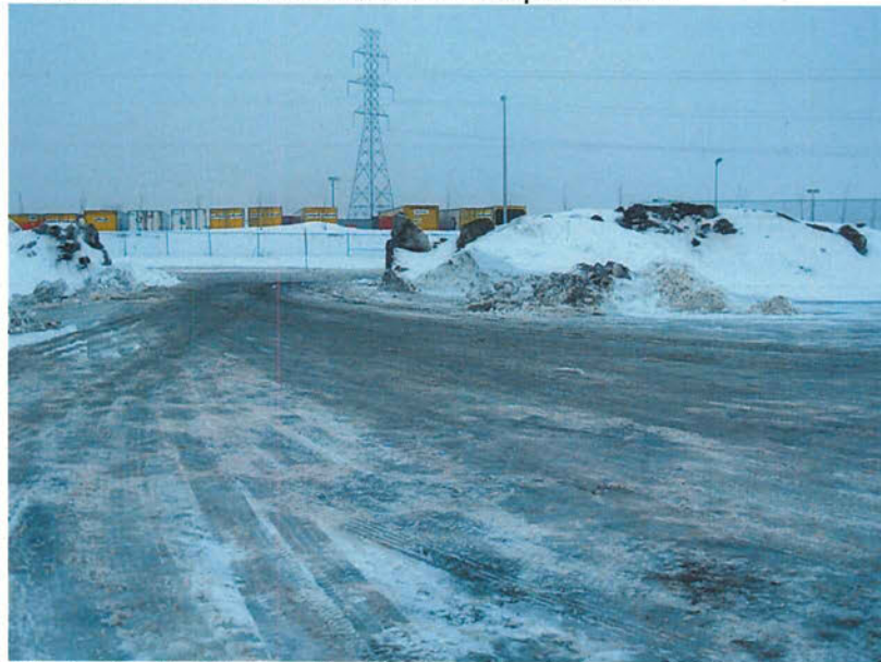
Photo 3 : Entrée sur le site à partir de la rue JA Bombardier. Vue sur la cour la compagnie Groupe Guilbault de l'autre côté de la rue.