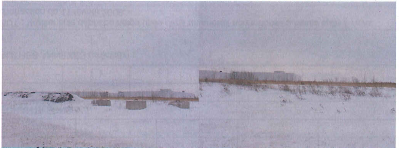
Photo 1 : blocs de béton installés afin de bloquer l'accès au terrain pour dépôt de neige

J'arrive sur les lieux par la rue JA Bombardier. Je constate qu'il n'y a pas de monticules de neige sur le lot 155 et que l'accès au site a été obstrué par des blocs de béton.