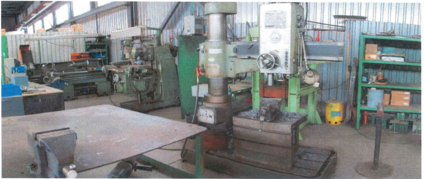
fusion 0017.jpg et 0018.jpg

Photo 1. Vue de l'intérieur du bâtiment, aucune production n'est réalisée.