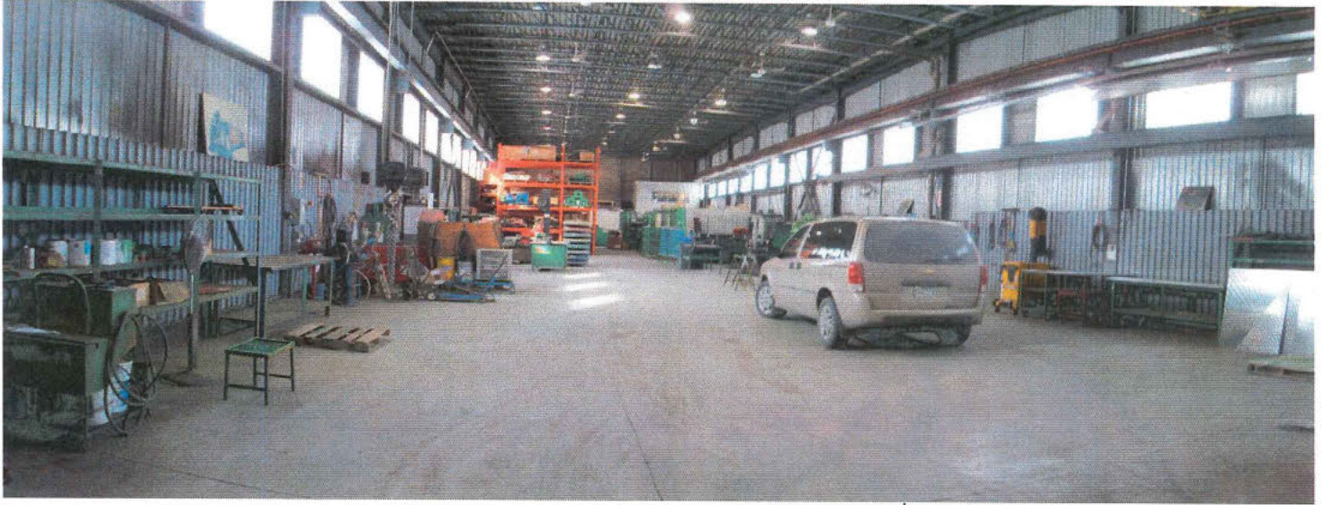
Fusion 0014.jpg et 0015.jpg

Photo 1. Vue de l'intérieur du bâtiment, aucune production n'est réalisée.