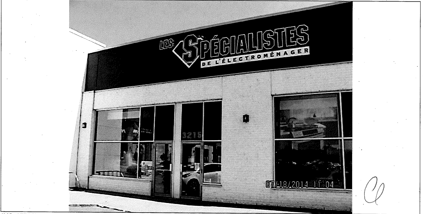
IMG_3775 [640x480].jpg Photo 1: Vue de la façade