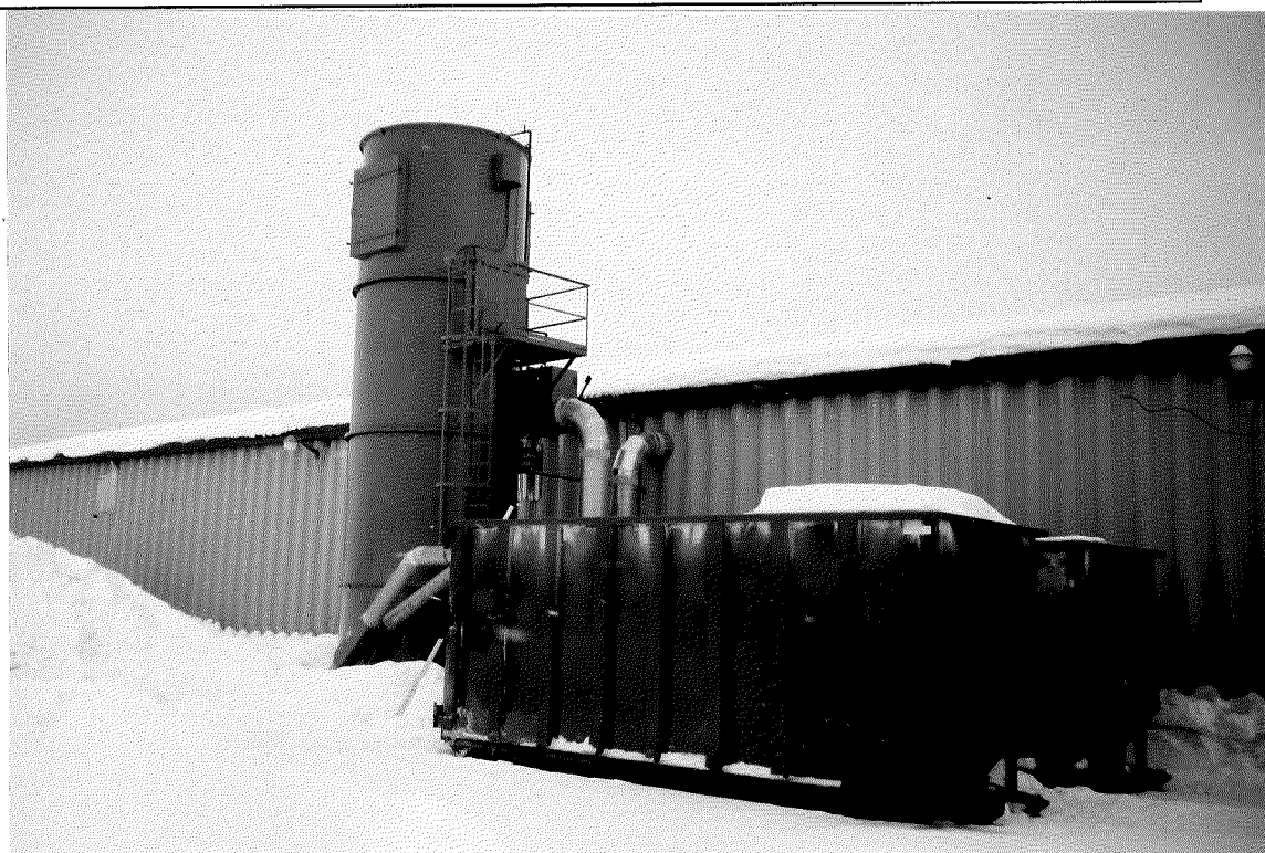
Photo #1 3 février 1998 Finition V.V. Crystal inc. St-tite 115, Rte 153 Dépoussiéreur et système de récupération des poussières de bois ppp Jocelyne Rioux