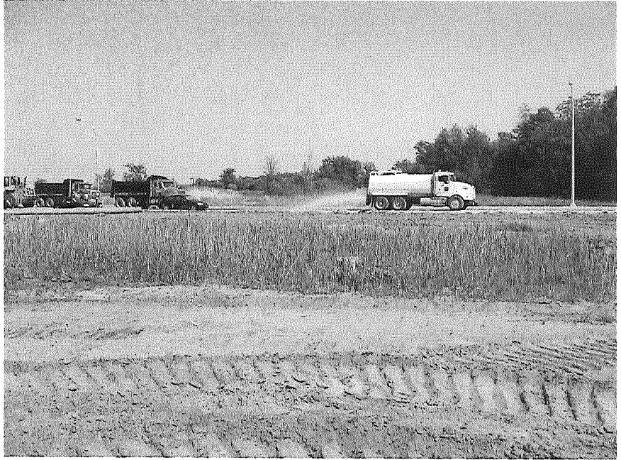
Photo prise par Mme. Marie-Noel Morissette, biologiste de la DRAE du MDDEP durant une visite sur le site le 25 mai 2010.

Note : Milieu humide #1, on remarque que le site est presque entièrement remblayé.