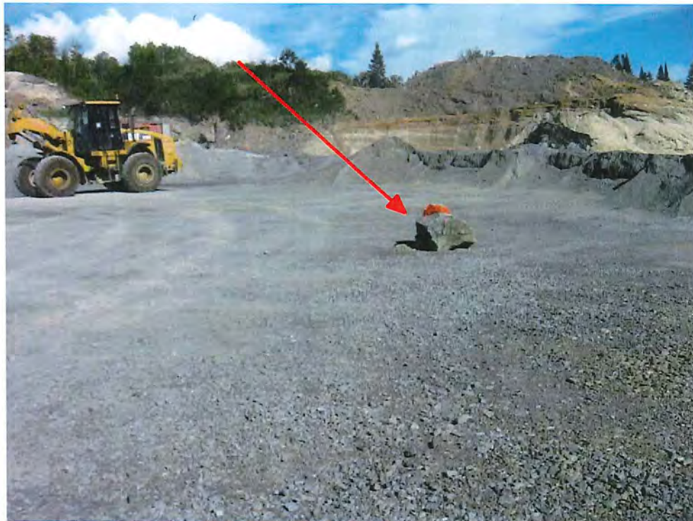
IMG_6977.JPG Repère (roche avec application de peinture)