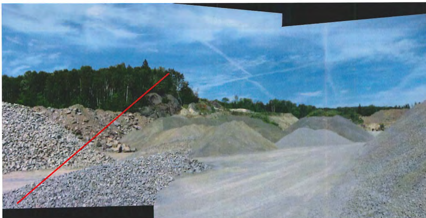
IMG_6772 Panorama.jpg idem photographie précédente. La ligne rouge indique la limite approximative carrière versus la sablière.