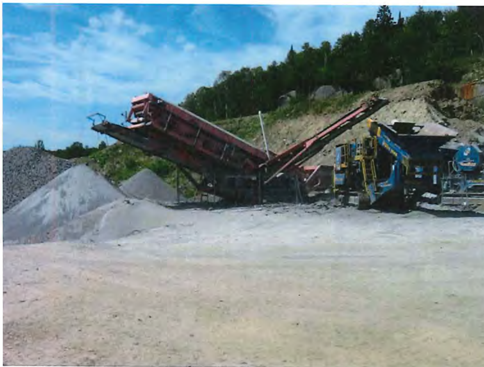
IMG_6744.JPG Concasueur dans la carrière