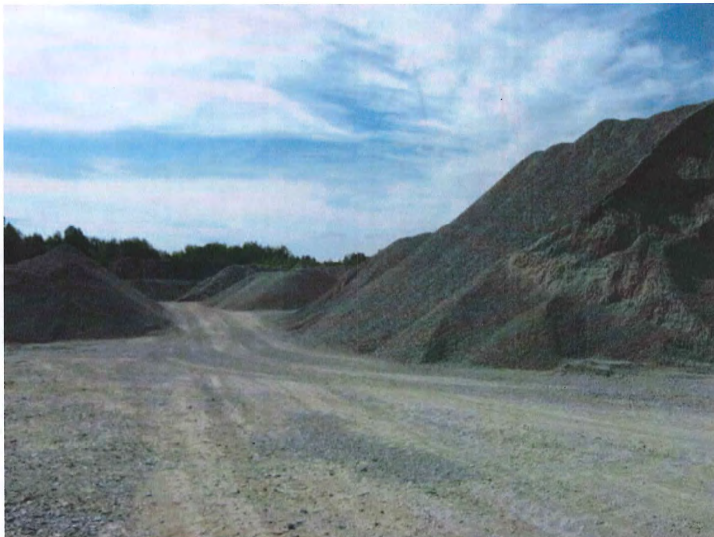
IMG_6765.JPG Vue des amas de pierres concassées entreposées dans la sablière