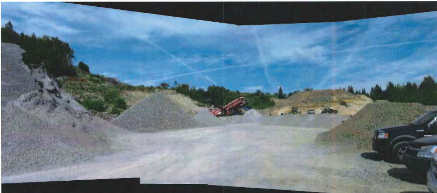
IMG_6767 Panorama.jpg Vue d'ensemble de la carrière.