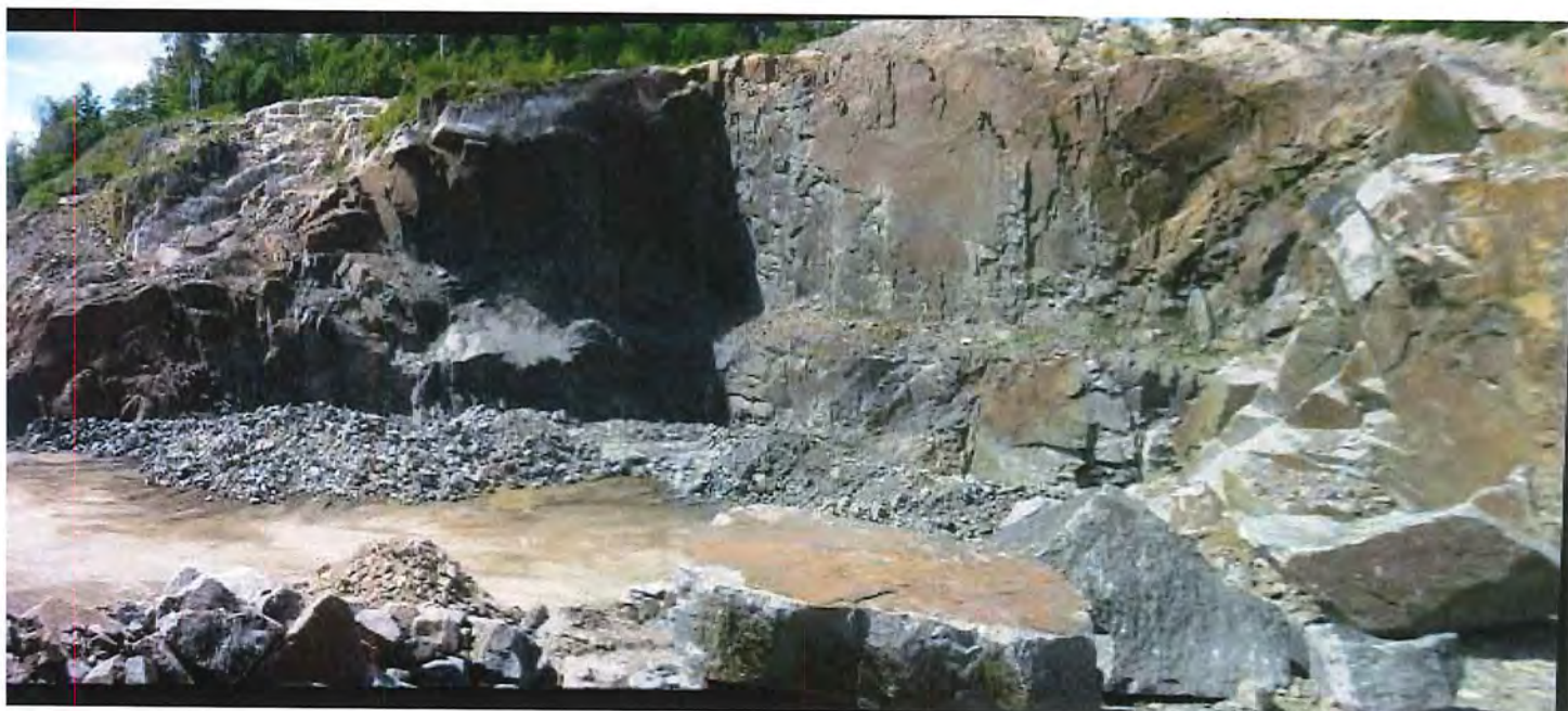
IMG_6751 Panorama.jpg front d'exploitation