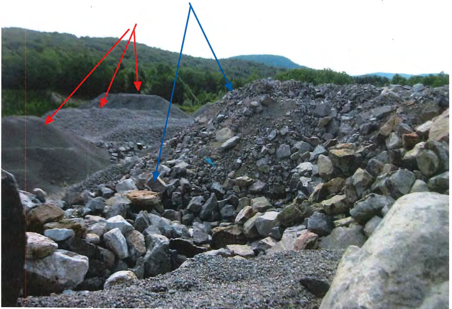
IMG_6778.JPG La flèche bleue indique les amas de roches importées et la flèche rouge les amas de pierres concassées entreposées (vue vers l'Ouest)