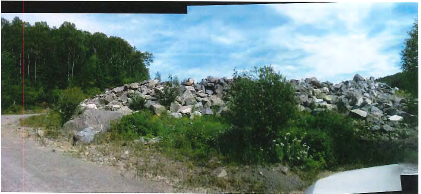
IMG_6775 Panorama.jpg Vue d'ensemble des amas de roches importées dans la sablière (vue vers l'Est)