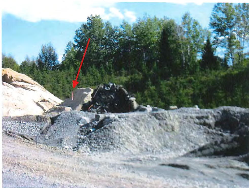
IMG_6980.JPG Repère (Piquet avec ruban)