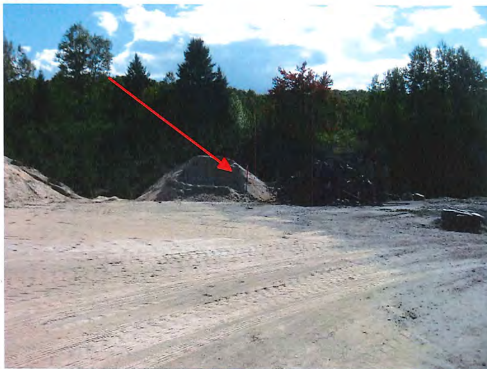
IMG_6979.JPG Repère (Piquet avec ruban)