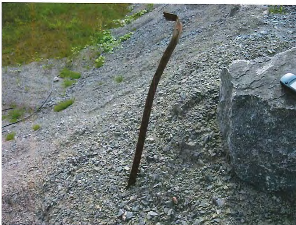
IMG_6762.JPG Seul piquet géoréférencé délimitant l'aire de concassage autorisé.