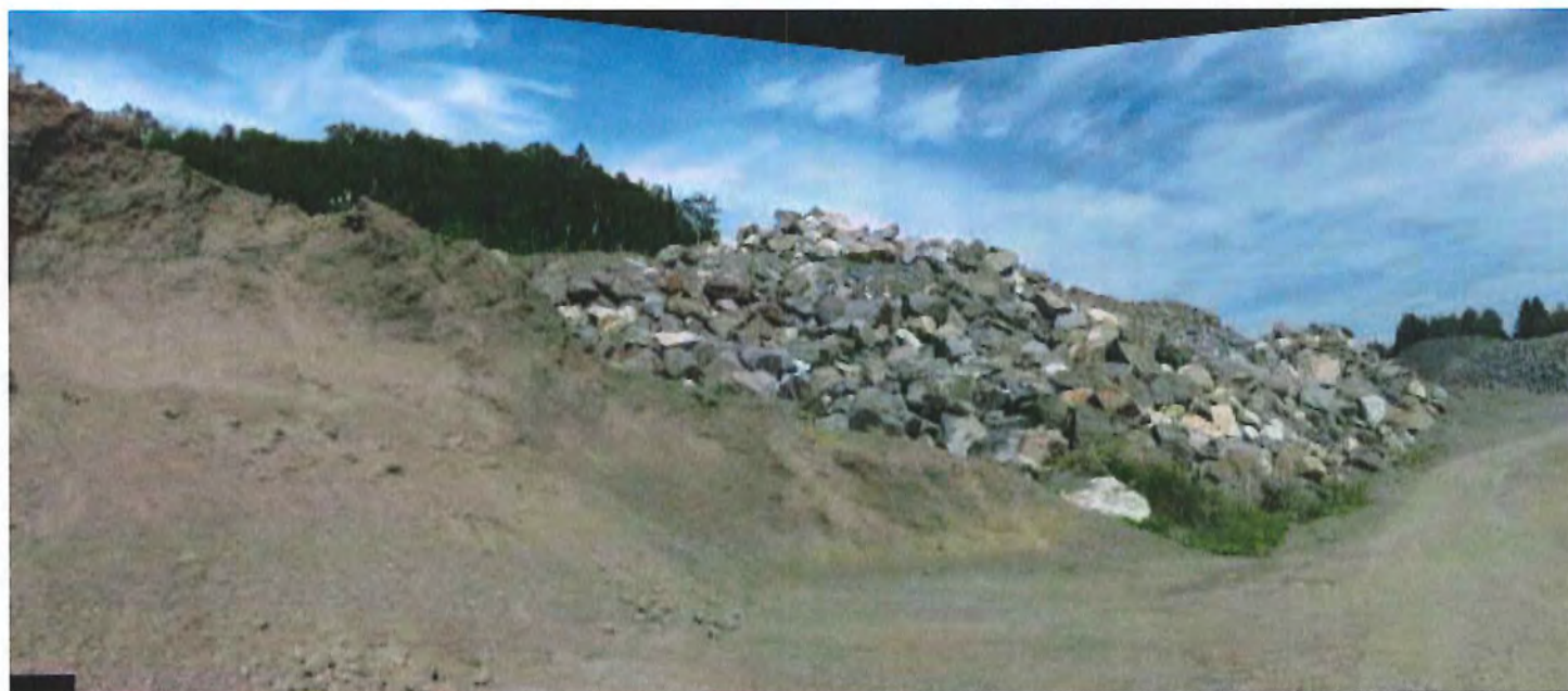
IMG_6791 Panorama.jpg Vue des roches importées dans la sablière via le niveau 1 de la sablière (vue vers l'Est)