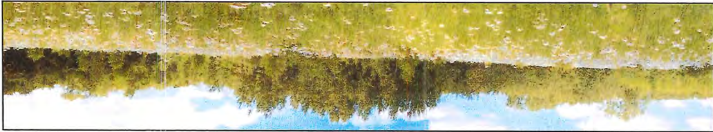
Photo # 2 Panorama 2 (Large).JPG Note : Vue panoramique du nord de la compensation.