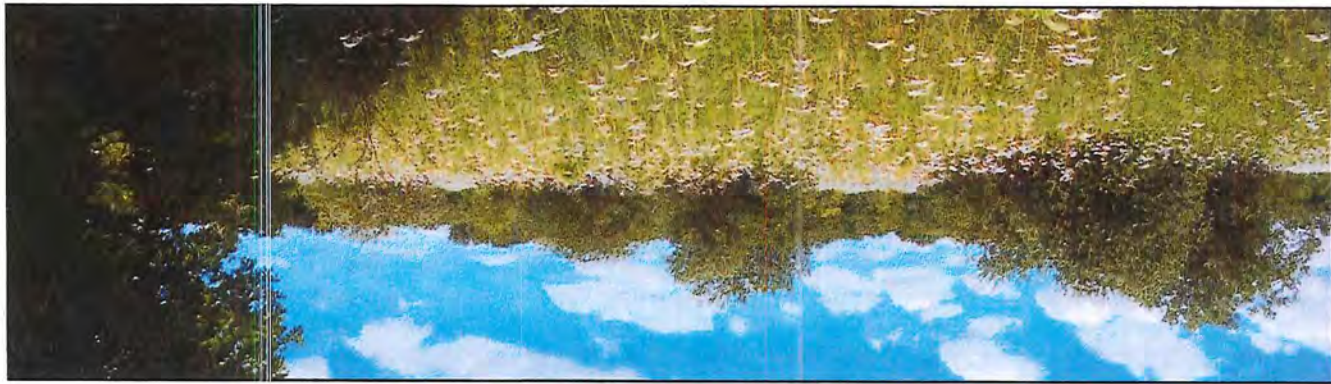
Photo # 3 Panorama 3 (Large).JPG Note : Vue panoramique à partir du sud-est de la compensation.