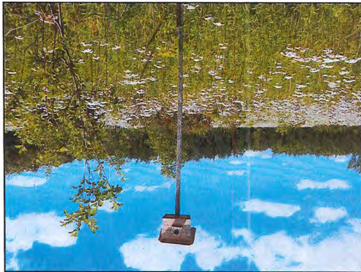
Photo # 4 DSCN0626 (Large).JPG Note : Nichoir présent sur le site de compensation.