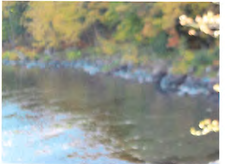
PHOTO5 : IMG_2511.JPG : L'embouchure du déversement