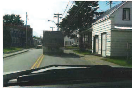
P1070816.JPG Dernier camion récupérant les sols contaminés identifié 23-24 de la compagnie 23-24