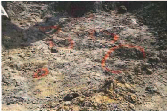
P1070813.JPG Autre présence résiduelle de contamination des sols par le diesel déversé.