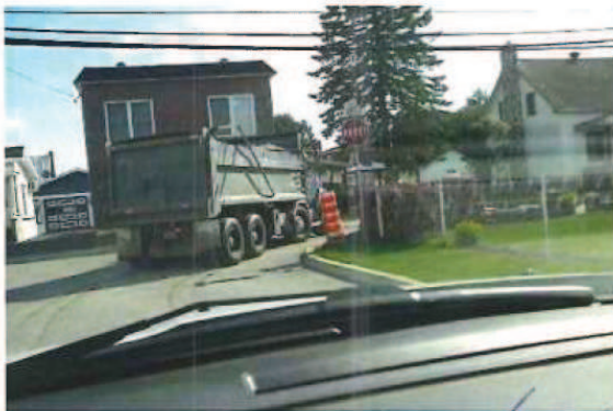
P1070815.JPG Récupération des sols contaminés.