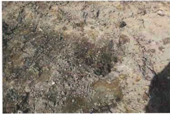
P1070812.JPG Présence résiduelle de contamination des sols par le diesel déversé.