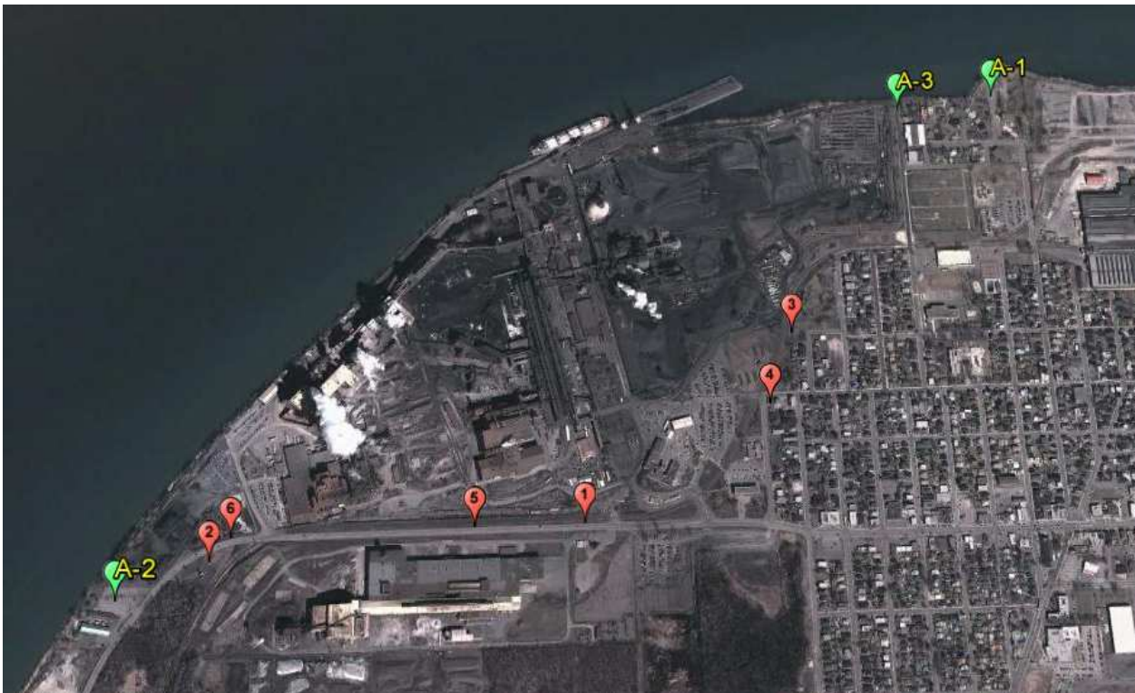
Figure 4 : Localisation du LEAE en position stationnaire lors des analyses de métaux

Les analyses de métaux en continu lorsque le laboratoire mobile LEAE était en position stationnaire à Saint-Joseph-de-Sorel les 15, 16, 30 et 31 juillet ainsi que les 29, 30 septembre et 1 er octobre ont été réalisées en temps réel à l'aide d'un analyseur à fluorescence par rayon X. Les positionnements du LEAE lors des analyses ont été choisis par rapport à la direction des vents majoritaires afin d'identifier et de quantifier les métaux émis par les différentes sources d'émission de la compagnie lors des activités normales de celle-ci. La localisation du LEAE lors des analyses en position stationnaire en amont (A-1 à A-3) et en aval (1 à 6) de l'entreprise où les métaux ont été caractérisés par l'analyseur de métaux sont présentés à la Figure 4. Les résultats d'analyses sont quant à eux présentés aux tableaux 7 (PST) et tableau 8 (matière particulaire de 10 \mu m et moins, PM 10 ).