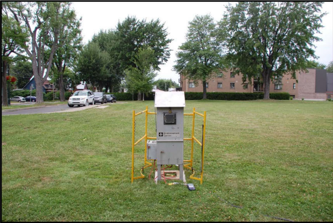
Photographie 5 : Terrain de l'église à côté du 921 Montcalm, Hi-Vol (T4).