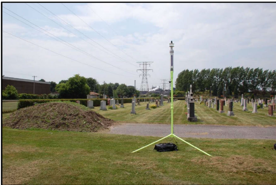
Photographie 1 : Lieu d'installation de la tour météo.