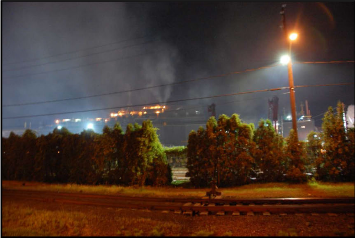
Photographie 7 : Marie-Victorin en face de l'Acierie le 15 juillet 2015, 22h22.