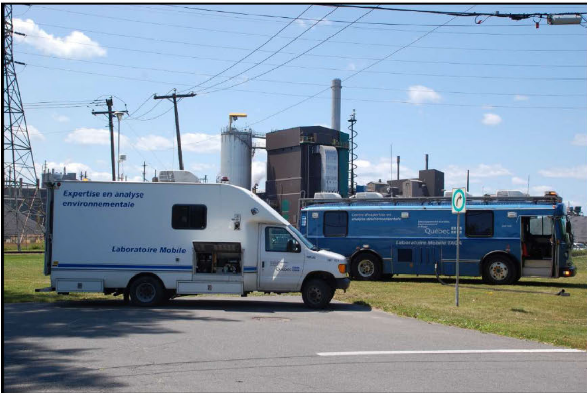
Photographie 8 : Terrain coin de la rue Moreau, usine de captation \text{SO}_2 le 16 juillet 2015, 13h56.