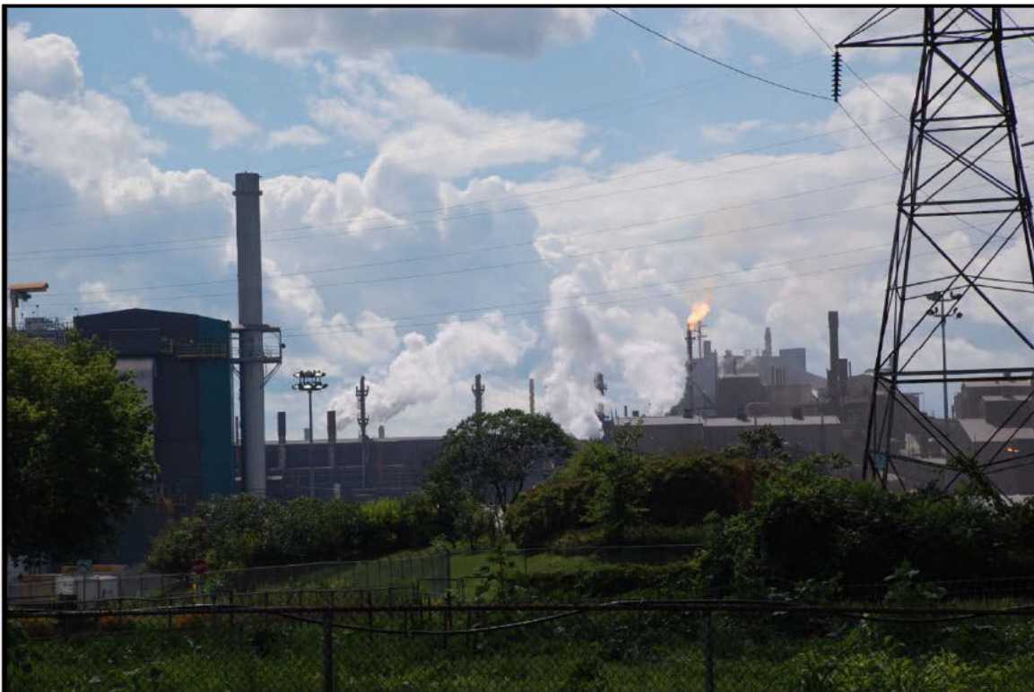
Photographie 10 : Terrain du jardin communautaire rue Leon XIII le 31 juillet 2015, 15h02.