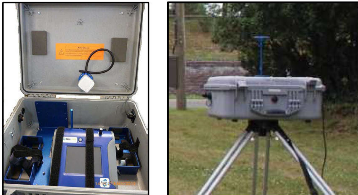
Figure 2 : Analyseur de particules en continu (DustTrak)

Les appareils DrusTrak ont été configurés pour fonctionner 24 heures sur 24 et pour enregistrer une donnée toutes les 2 minutes. Un étalonnage du zéro est effectué automatiquement quatre fois par jour et chaque instrument est étalonné une fois par année selon les recommandations du fabricant. Les instruments étaient arrêtés à tour de rôle, à chaque 5 à 8 jours, de façon à télécharger les données pour ensuite être relancés.