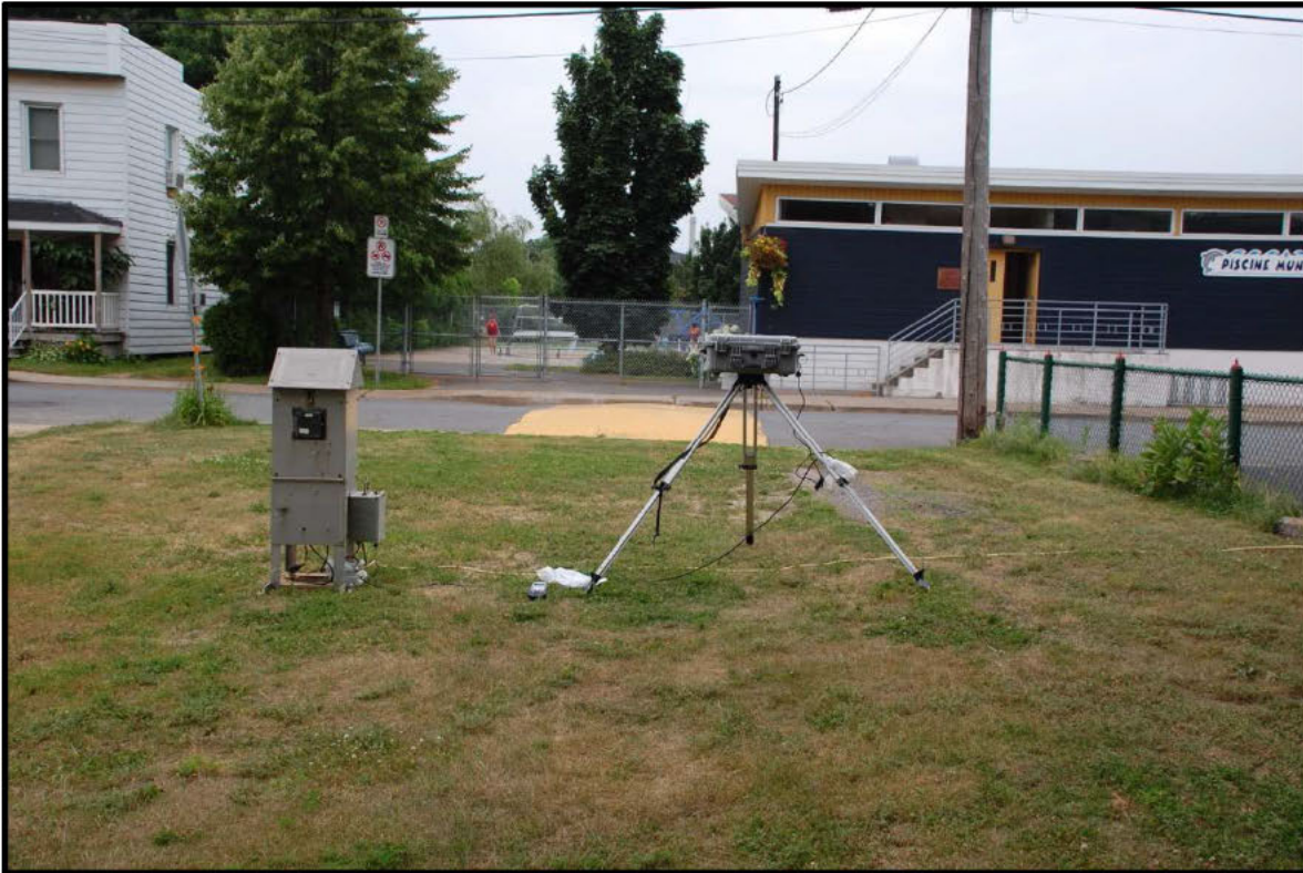
Photographie 4 : terrain vague à côté du 122 rue St-Joseph, Hi-Vol et DustTrak (T3).