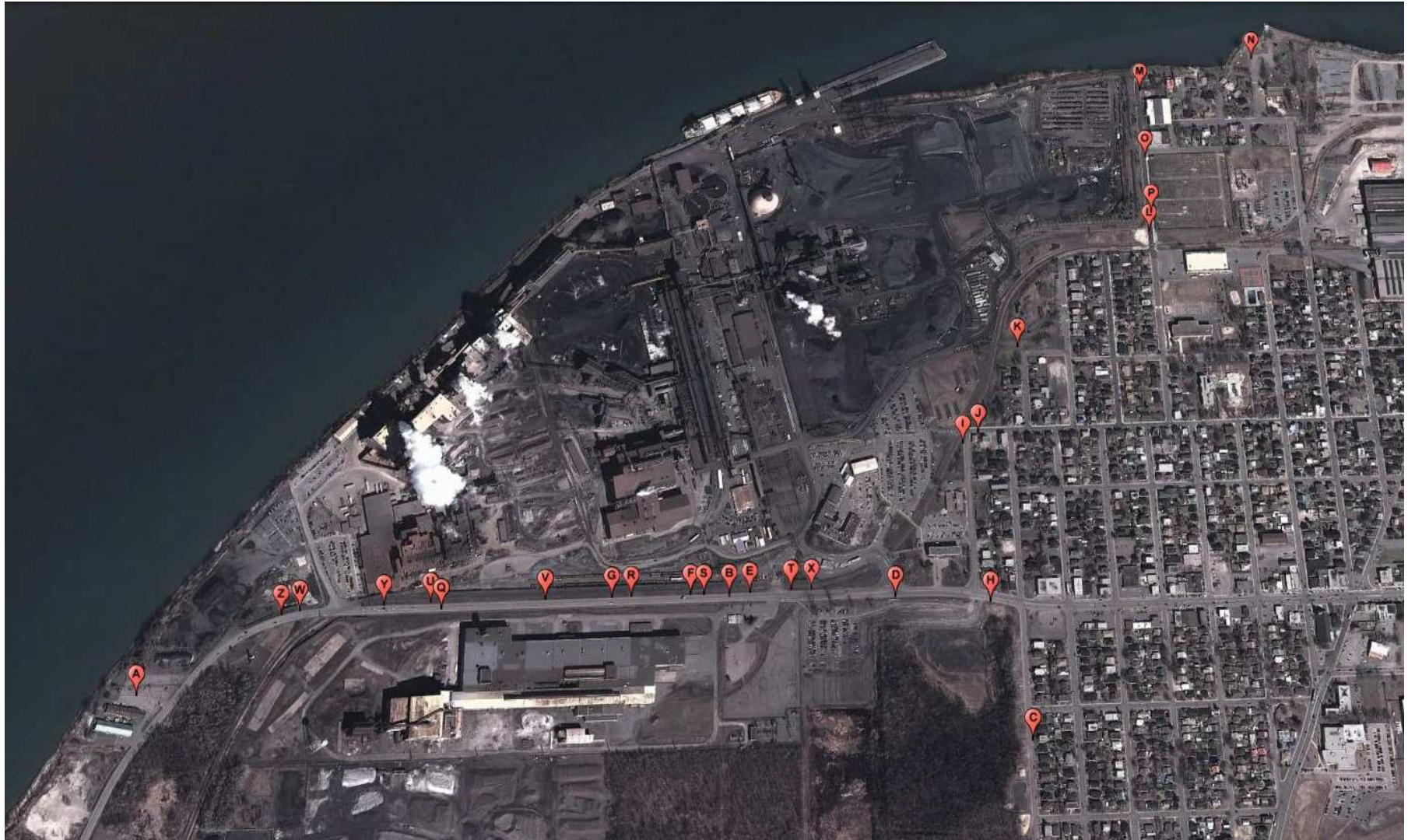
Figure 5 : Localisation du laboratoire mobile TAGA en position stationnaire