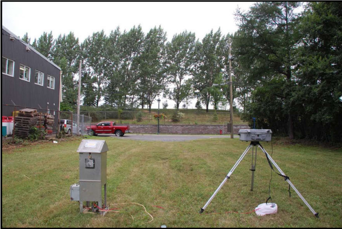
Photographie 3 : Terrain vague à côté du 10 Leon XIII (Acier Regifab), Hi-Vol et DustTrak (T2).