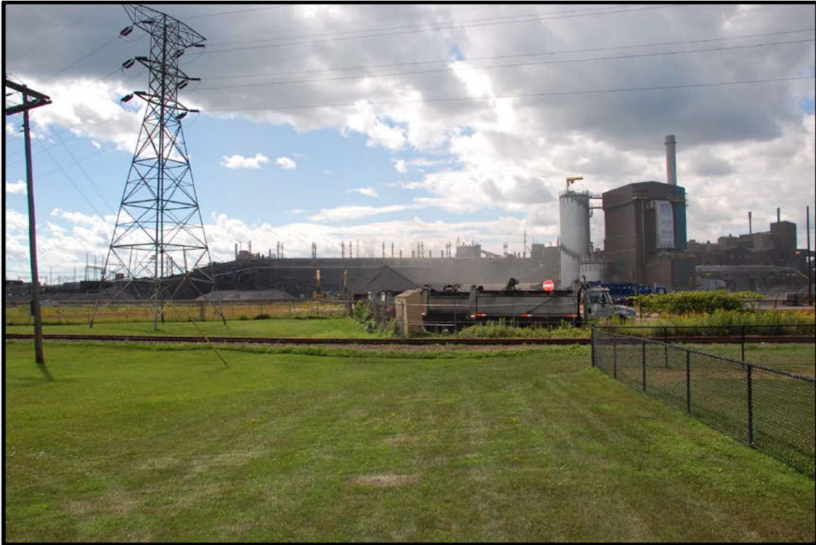
Photographie 9 : Terrain coin de la rue Moreau, le 31 juillet 2015, 14h29.