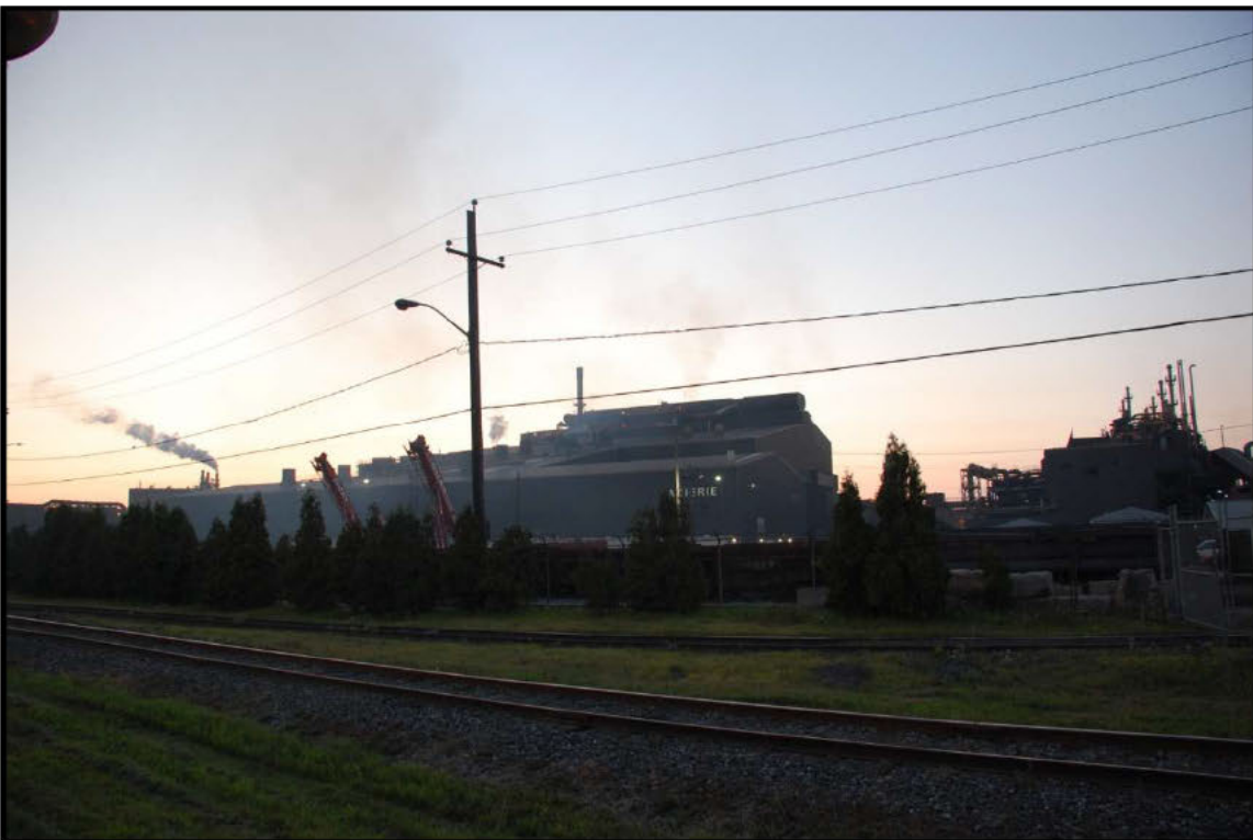
Photographie 6 : Marie-Victorin au Sud-Est de l'Acierie le 15 juillet 2015, 20h32.