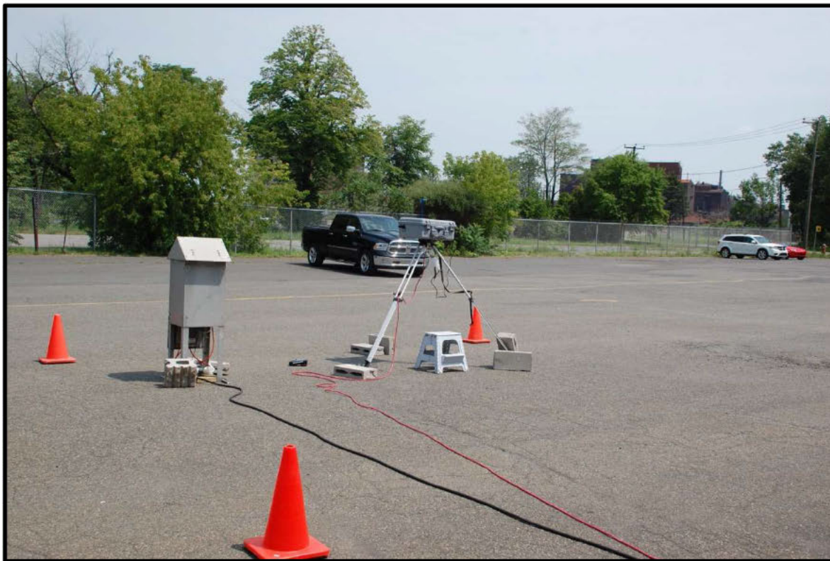
Photographie 2 : 1681 Marie-Victorin, Hi-Vol et DustTrak (T1).