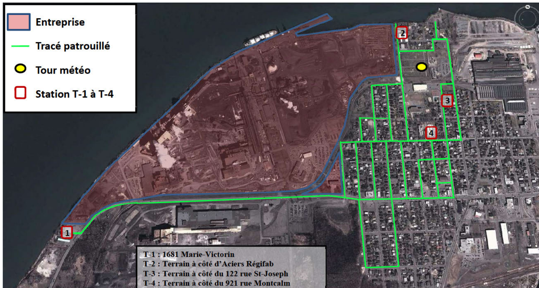
Figure 1 : Secteur caractérisé