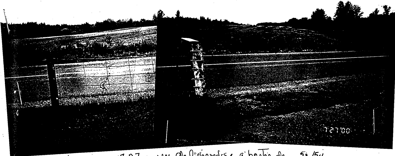
Photo 1 et 2, 2000-07-27 - vue de l'épandage à partir de 53/54

Identification : Ferme Laitière Le Roulet et fils Épandage near Ste Anne, St Armand