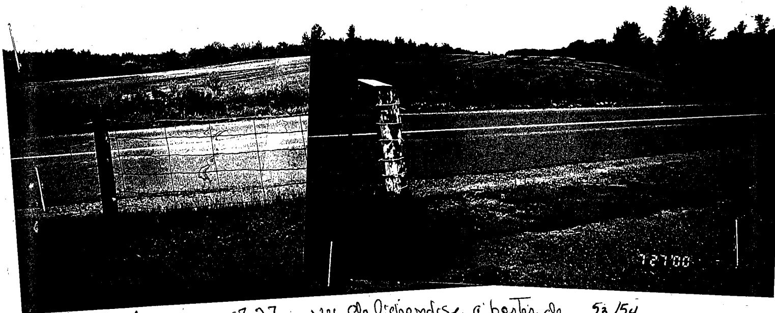
Photo 1 et 2, 2000-07-27 - vue de l'épandage à partir de 53/54

Identification : Ferme Larivière & Lévesque et fils Épandage near Ste Anne, St Armand