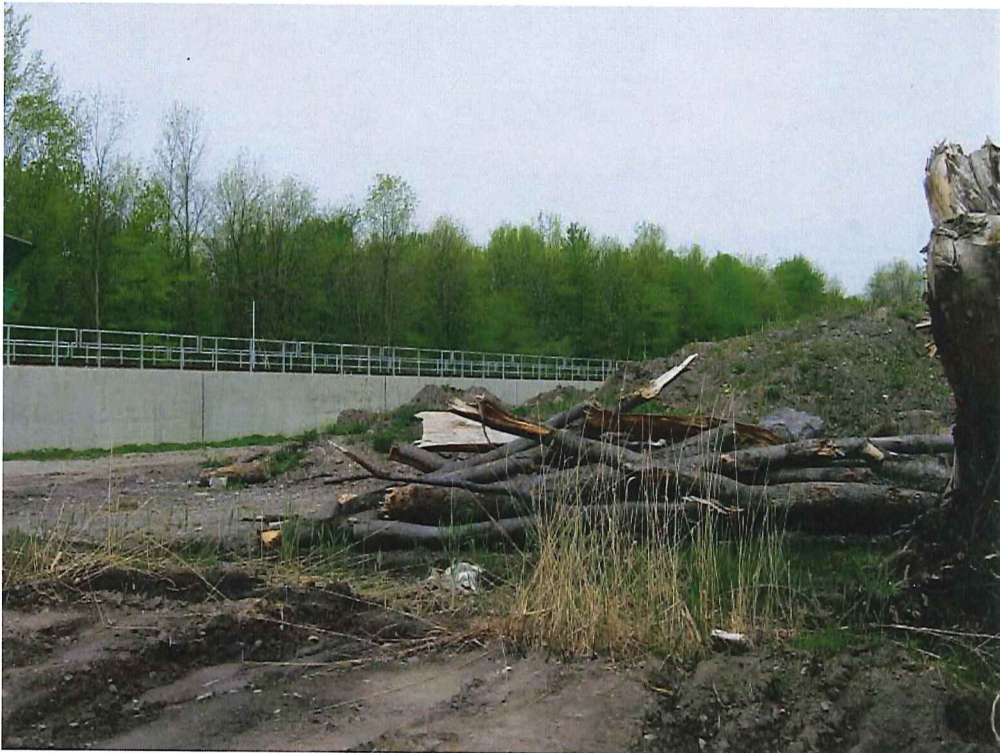
IMG_1909.jpg Amas de terre mélangé à matières résiduelles généré par les travaux d'exavation pour la mise en place du train