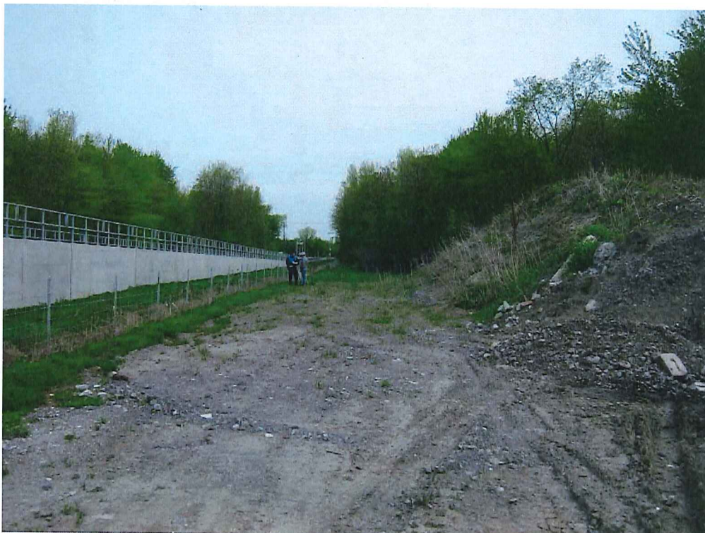
IMG_1910.jpg Amas de terre mélangé à matières résiduelles généré par les travaux d'exavation pour la mise en place du train