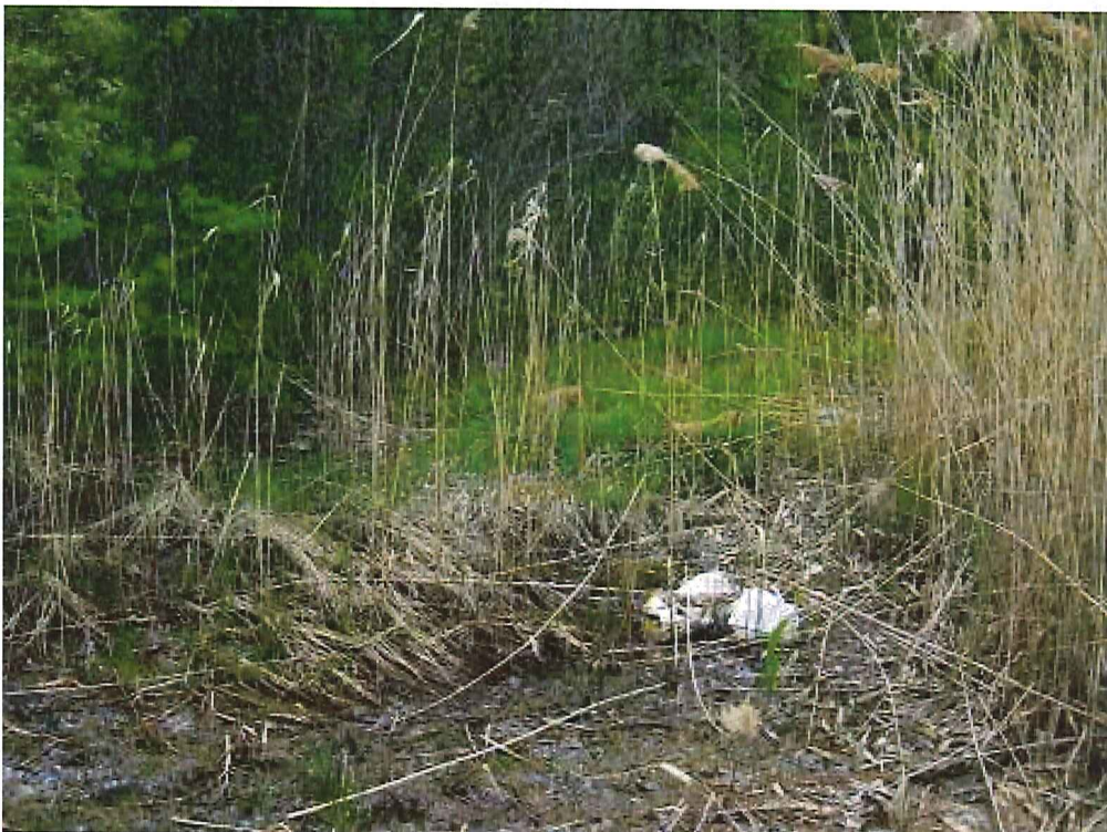
IMG_1916.jpg Milieu humide