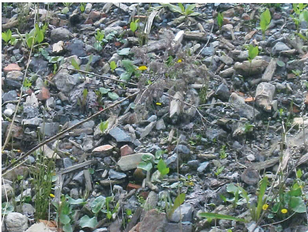
IMG_1914.jpg Zoom sur les matières résiduelles qui se trouvent dans l'amas