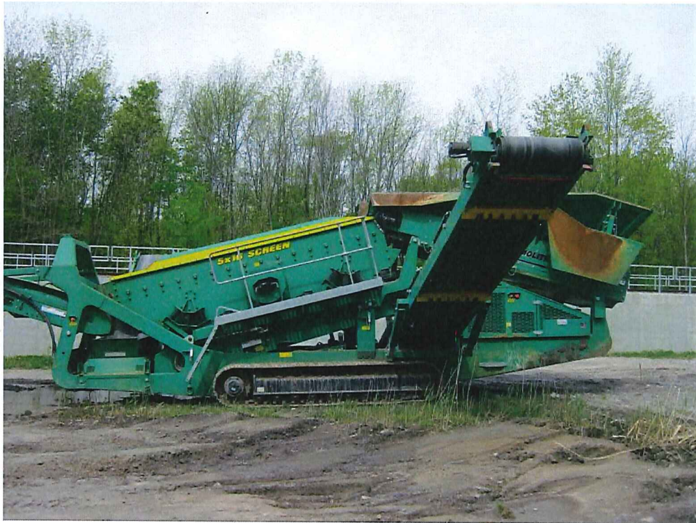
IMG_1908.jpg Équipement destiné à tamiser de la terre