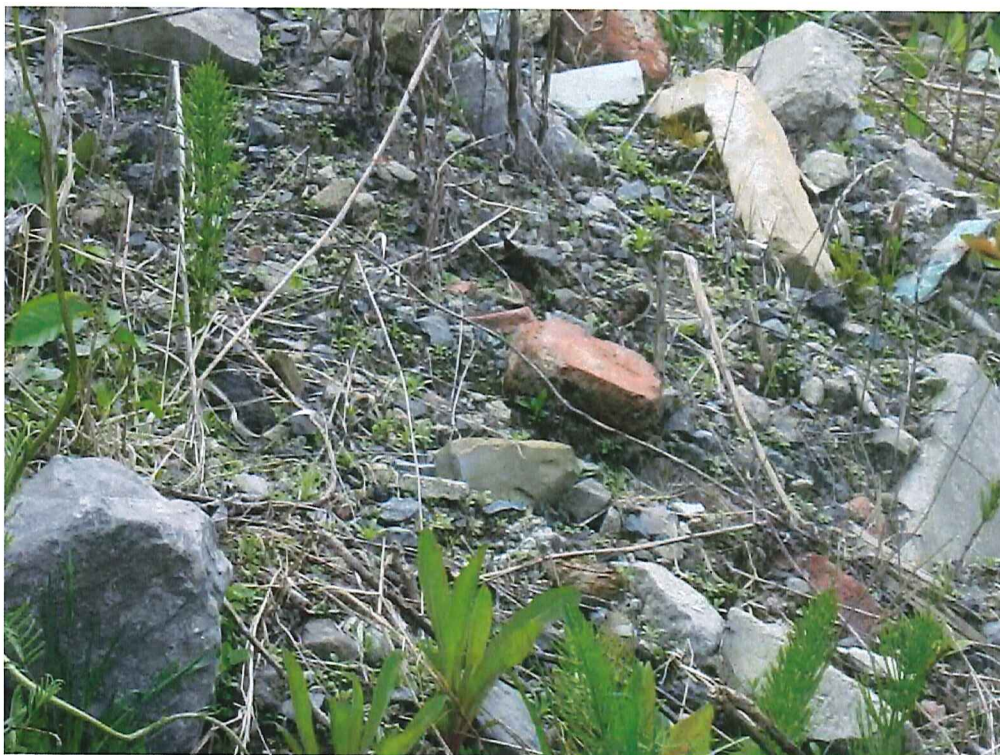
IMG_1915.jpg Zoom sur les matières résiduelles qui se trouvent dans l'amas