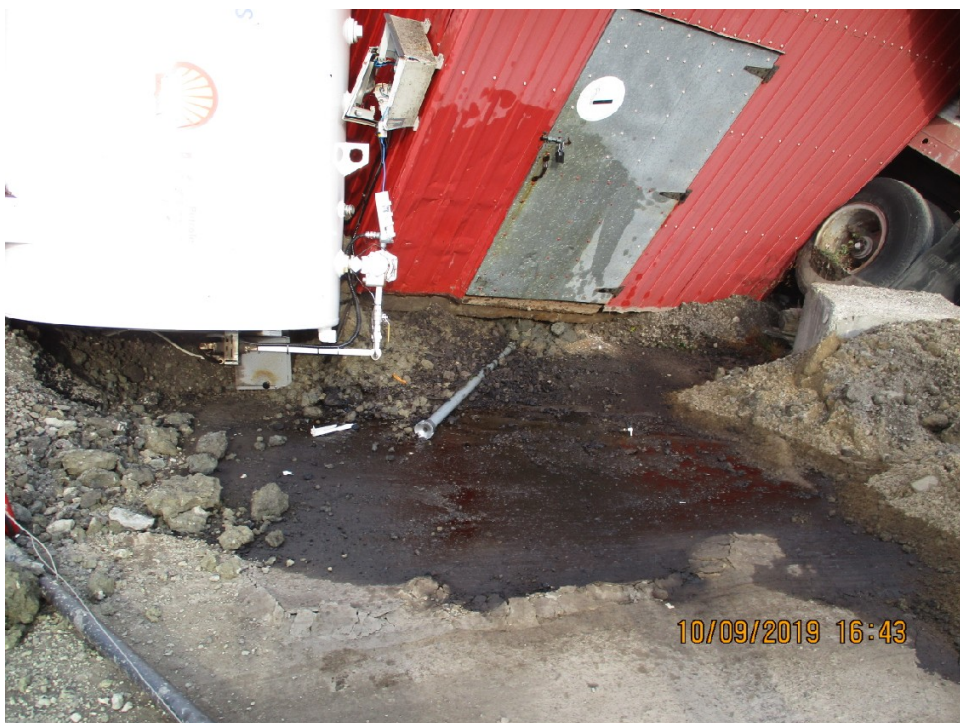
IMG_0254.JPG Photo 05 : Vue du déversement de diesel dans l'environnement