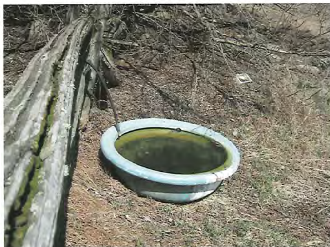
IMG_1701.jpg Abreuvoir à côté du bâtiment d'élevage