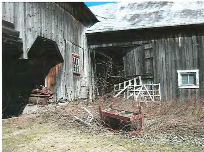
IMG_1700.jpg État fétuste du bâtiment d'élevage