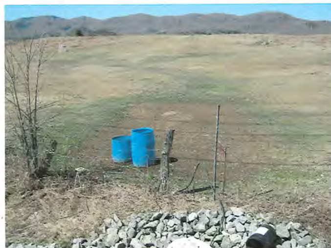
IMG_1713.jpg d'autres abreuvoirs dans un pâturage