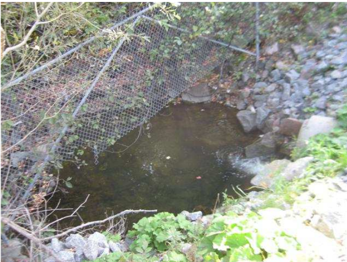
PHOTO5 : IMG_2511.JPG : L'embouchure du déversement

Pancarte indiquant la présence du trop plein du régulateur 1