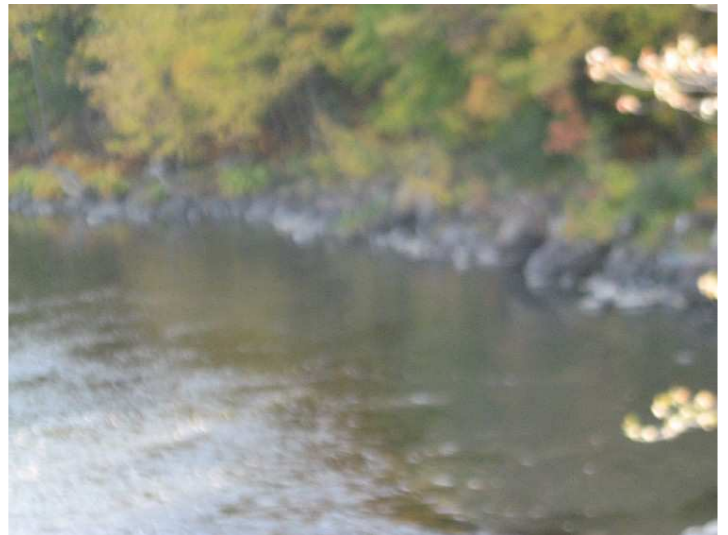
PHOTO 6 : IMG_2512.JPG Nappe de couleur opaque environ de 2 à 4 m de large et de 20 à 25 m de long