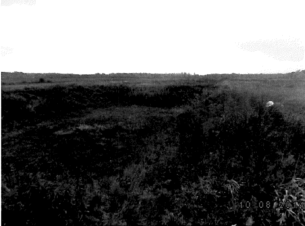
Canbriam 002.jpg Bassin en place