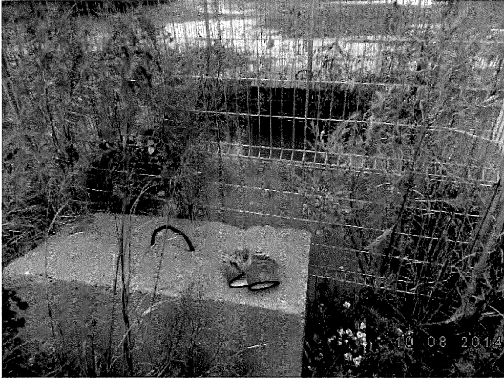
Canbriam 001.jpg Tête de puits sous l'eau