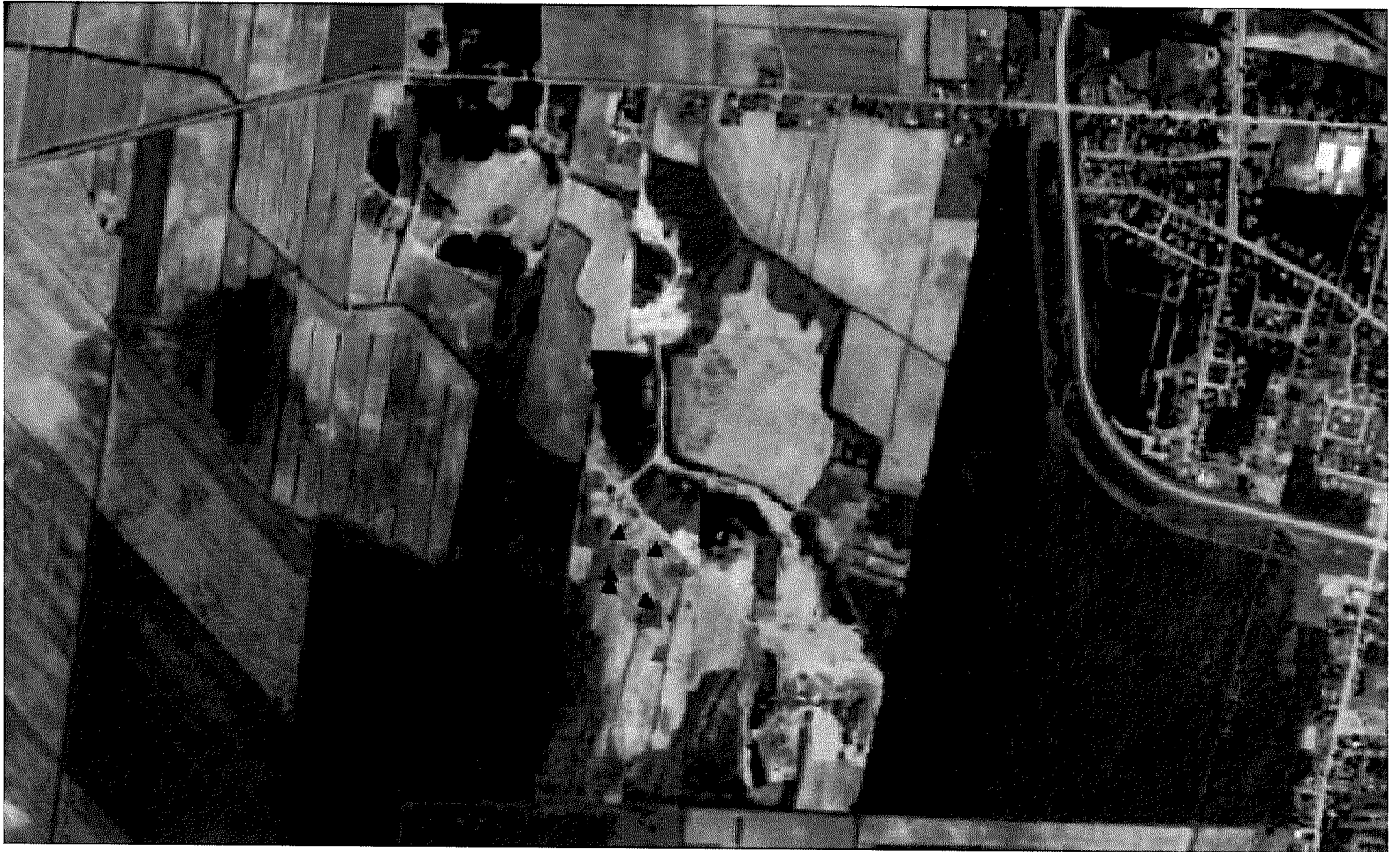
Localisation du puits