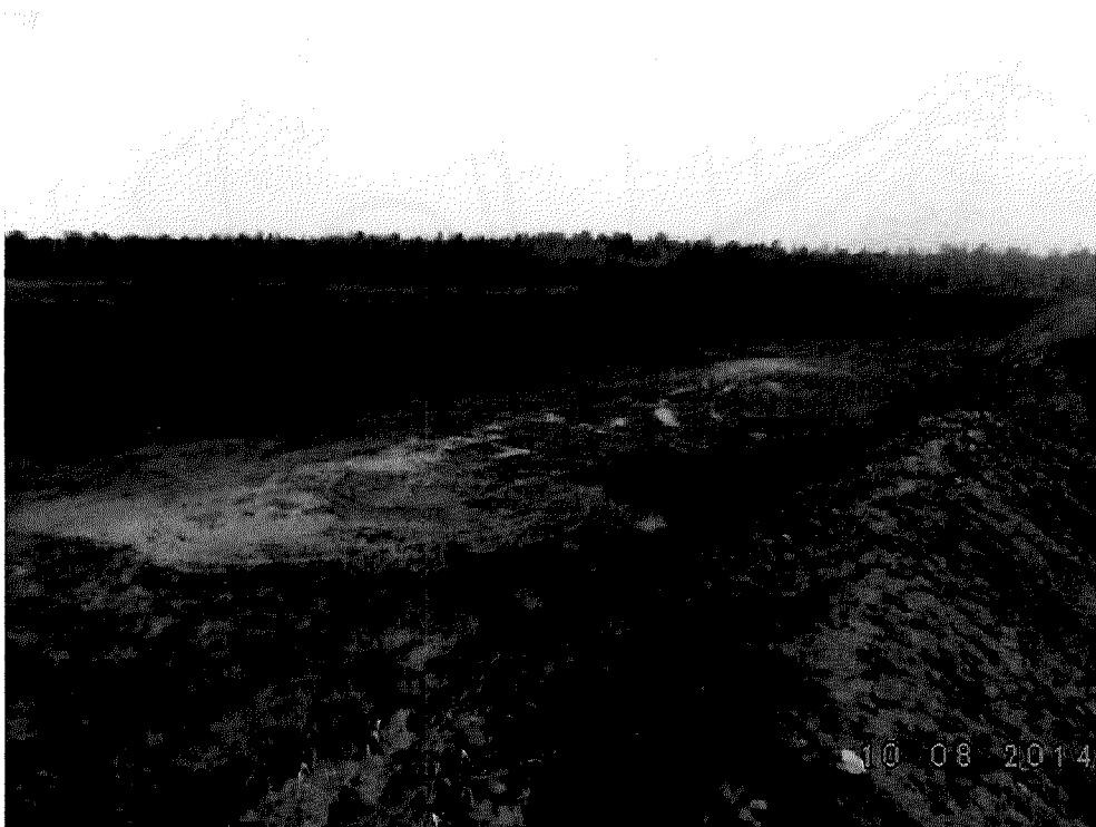
Canbriam 003.jpg Bassin en place