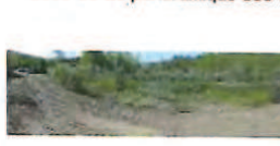
2008-05-28 panoramique 011 à 014.jpg