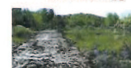
2008-05-28 panoramique 003-004.jpg