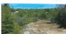
2008-05-28 panoramique 009-010.jpg