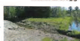
2008-05-28 panoramique 006-007.jpg